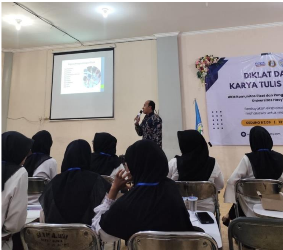
Gambar 2. Sesi Tanya Jawab

Sesi kedua yaitu sesi tanya jawab dengan durasi waktu selama 30 menit. Di dalam sesi ini para mahasiswa diberikan kesempatan untuk bertanya dan berbagi terkait apa yang sekiranya belum dipahami dalam penelitian kependidikan. Ada beberapa pertanyaan yang muncul di benak para mahasiswa diantaranya itu: