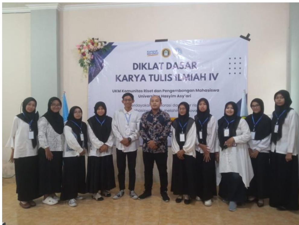
Gambar 3. Sesi Evaluasi

Sesi terakhir dari kegiatan pengabdian masyarakat yang disinergikan antara UKM KRPM (Komunitas Riset Penelitian Mahasiswa) dan tim dosen metodologi penelitian kependidikan Universitas Hasyim Asy'ari Tebuireng Jombang adalah evaluasi. Dalam sesi evaluasi ini