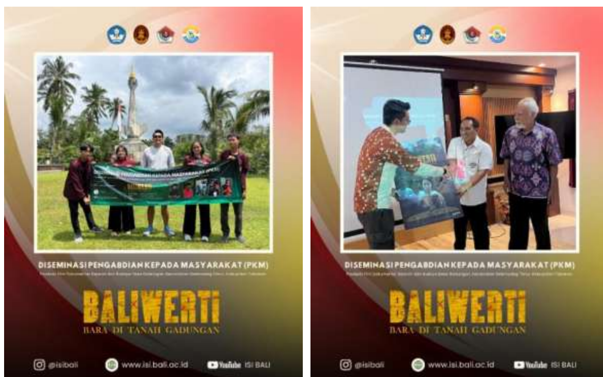
Gambar 8. Acara diseminasi dan pemutaran film dokumenter “Baliwerti: Bara di Tanah Gadungan”

Kami berharap karya ini tidak berhenti di sini, tetapi bisa menjadi awal dari kolaborasi yang berkelanjutan antara masyarakat, akademisi, dan pemerintah desa dalam menjaga dan mengembangkan warisan sejarah yang kita miliki.”