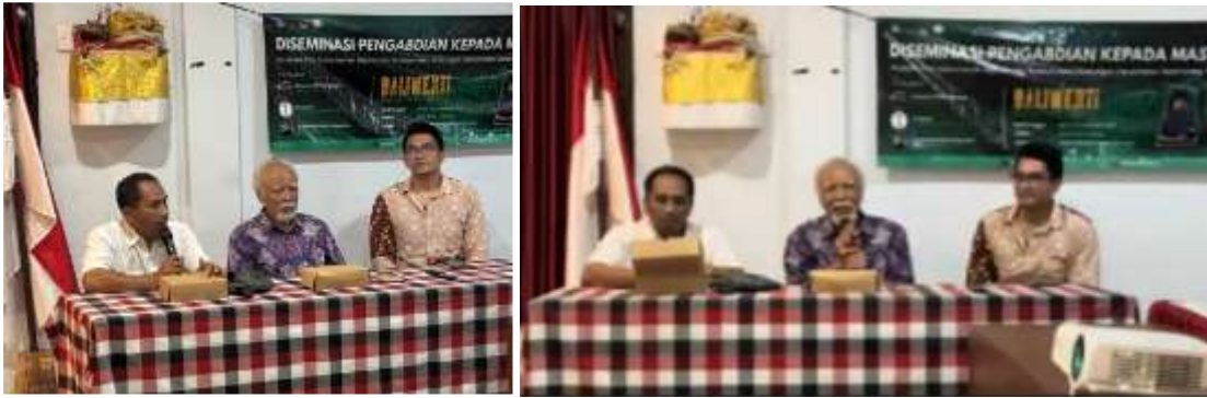
Gambar 9. Sambutan dari Kepala Desa Gadungan dan Sesepeuh Desa

Acara diseminasi ditutup dengan pemutaran film dokumenter yang disaksikan bersama masyarakat desa Gadungan.