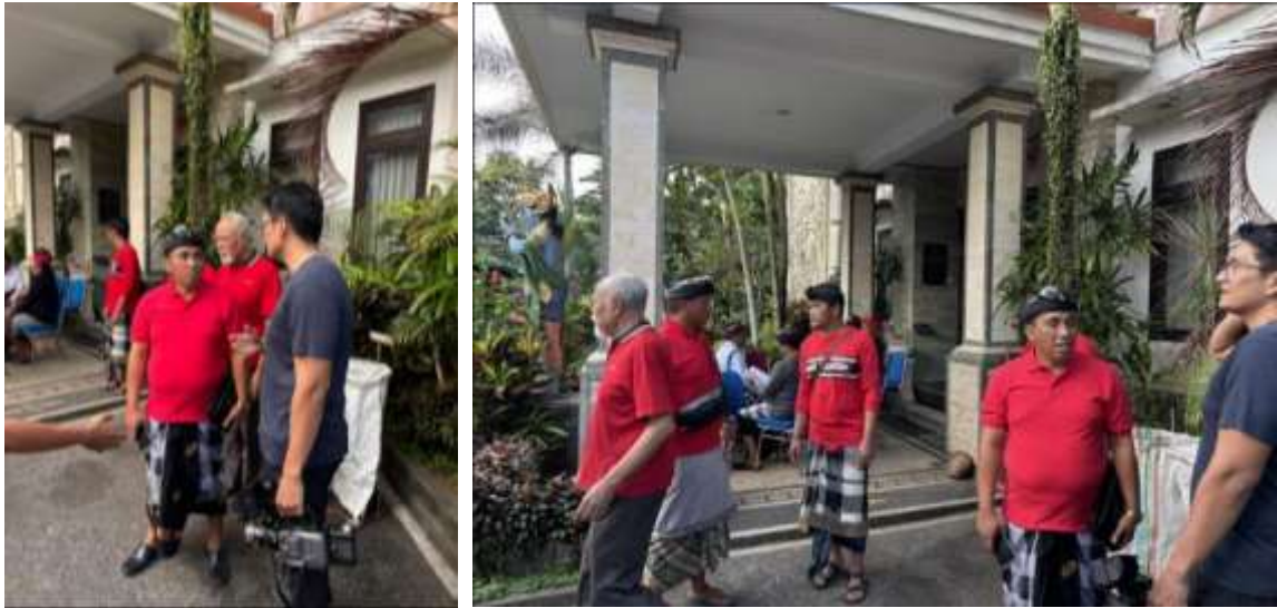
Gambar 2. Bertemu dengan tokoh-tokoh masyarakat