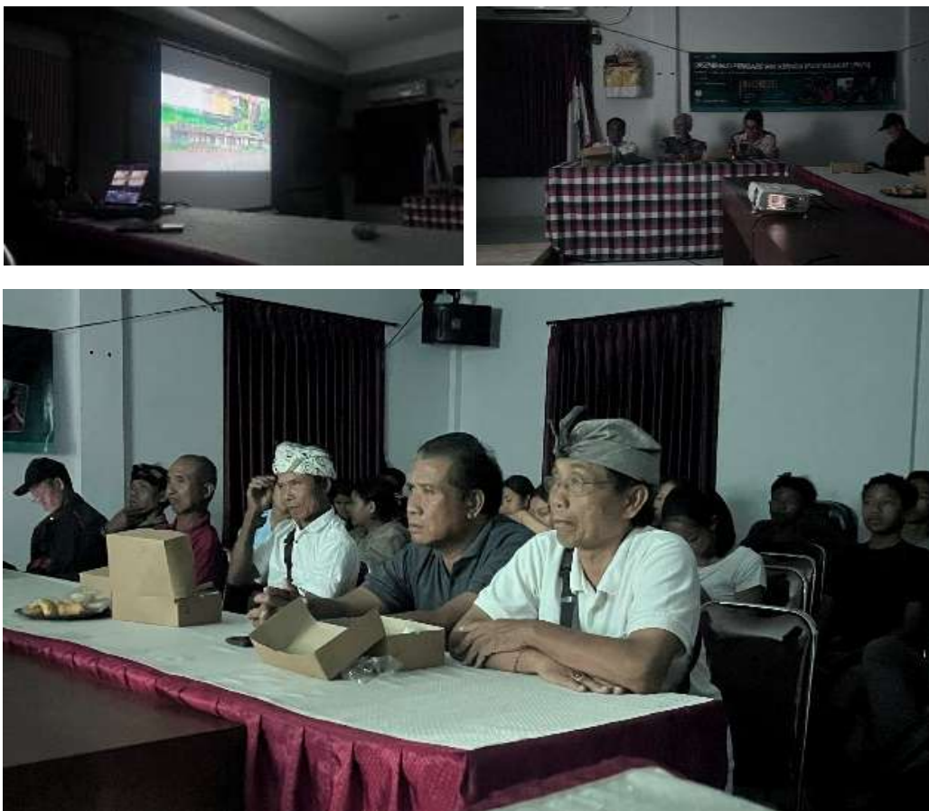
Gambar 10. Pemutaran film dokumenter “Baliwerti: Bara di Tanah Gadungan”

Acara diseminasi ditutup dengan pemutaran film dokumenter yang disaksikan bersama masyarakat desa Gadungan.