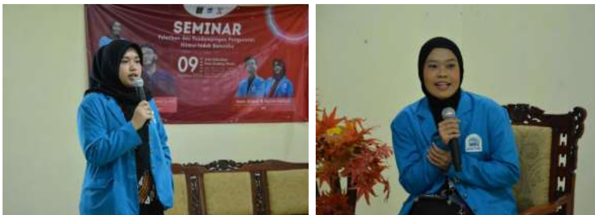
Gambar 1. Sesi penyampaian materi dalam seminar penyuluhan NIB

Gambar yang ditampilkan berikut merupakan dokumentasi visual kegiatan seminar dan sesi tanya jawab. Gambar ini menunjukkan interaksi dua arah yang terbentuk selama penyuluhan berlangsung.