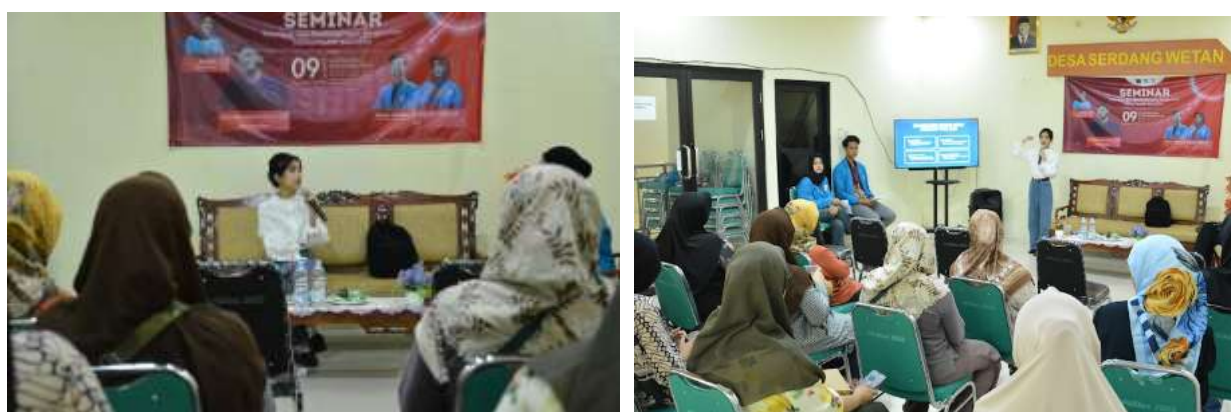
Gambar 2. Diskusi peserta dan narasumber saat sesi tanya jawab

Selain itu, efektivitas kegiatan juga diukur melalui kuesioner singkat mengenai pemahaman peserta terhadap topik NIB sebelum dan setelah kegiatan. Grafik berikut menampilkan hasil peningkatan skor rata-rata peserta.