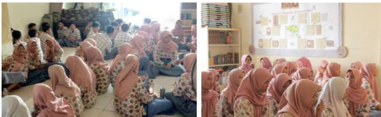
Gambar 2. Peserta pelatihan

Pelaksanaan pelatihan terealisasi dengan diikuti 55 peserta pendidikan nonformal PKBM Binar dengan usia setara siswa sekolah menengah kelas X-XII, sebagaimana pada Gambar 2. Kegiatan pelaksanaan pelatihan diadakan pada 17 Desember 2025, bertepatan dengan masa class meeting siswa setelah menempuh ujian semester. Sesi pertama pelatihan difokuskan pada pengantar kegiatan dan pengenalan jenis plastik kresek sebagai material kriya. Pemateri memberikan pengetahuan dasar tentang karakteristik plastik kresek yang biasanya terbuat dari polietilena (PE), seperti High-Density Polyethylene (HDPE) dan Low-Density Polyethylene (LDPE), serta contoh fisik dari bahan yang biasa ditemukan dalam kehidupan sehari-hari. Selain itu, peserta dikenalkan dengan istilah yang umum digunakan Masyarakat, seperti asoy, kantong HD, atau kresek, yang pada dasarnya berbeda berdasarkan kerapatan material, warna, ketebalan, dan kegunaannya. Selain itu, dibahas pula kondisi umum limbah plastik kresek yang banyak beredar di lingkungan sekitar dan cara mendapatkan plastik kresek yang masih dapat digunakan secara praktis, baik di rumah tangga maupun di lingkungan sekitar.