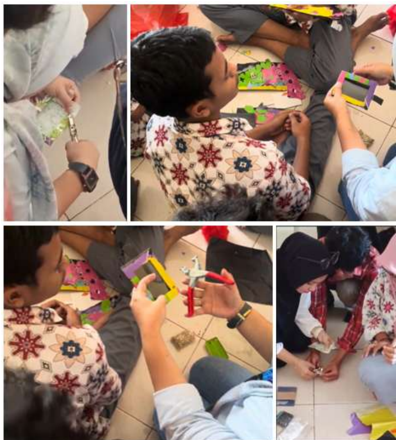
Gambar 9. Peserta dibantu tim pengabdian melakukan tahap perakitan.

Setelah proses perakitan, peserta merapihkan bagian tepi produk dan memastikan ID card holder siap digunakan sebagai tahap finishing. Pada tahap ini, peserta meninjau ulang hasil karya peserta dari sudut pandang bentuk dan fungsi. Tahap finishing ini sangat penting dalam praktik kriya untuk memastikan bahwa produk tidak hanya berbentuk, tetapi juga layak digunakan dan dipasarkan.