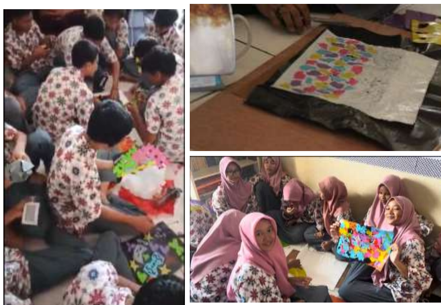
Gambar 7. Lembaran hasil pengepresan sederhana.