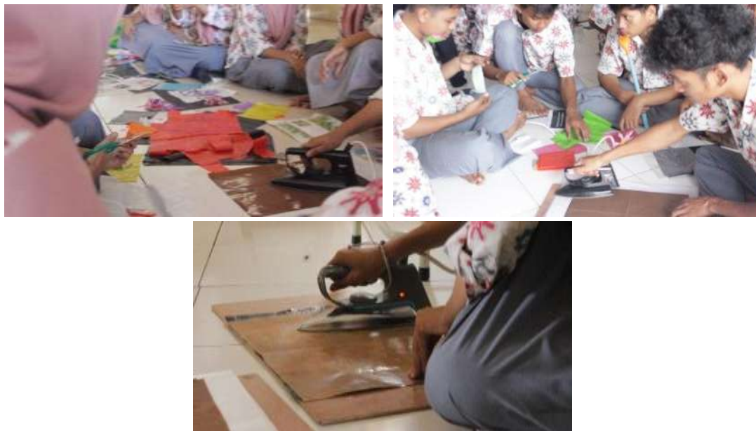
Gambar 6. Peserta melakukan tahap pengepresan sederhana.

Selanjutnya proses pengepresan plastik kresek yang dilakukan bergantian oleh peserta dengan bantuan tim pengabdian, seperti ditunjukkan Gambar 6. Setelah mendapatkan instruksi tentang cara pengepresan plastik kresek secara aman, peserta kemudian menerapkan intruksi tersebut secara langsung pada susunan material yang telah dibuat sebelumnya. Hasil dari proses pengepresan adalah lembaran plastik kresek yang mengalami perubahan visual, seperti peningkatan ketebalan, perubahan tekstur, dan penyatuan warna pada satu permukaan material, sebagaimana digambarkan Gambar 7. Pada tahap ini kreativitas peserta dalam menghasilkan kombinasi warna akan terlihat. Lembaran material yang dihasilkan dari proses pengepresan ini digunakan sebagai dasar untuk tahap pembuatan produk kriya di sesi berikutnya.