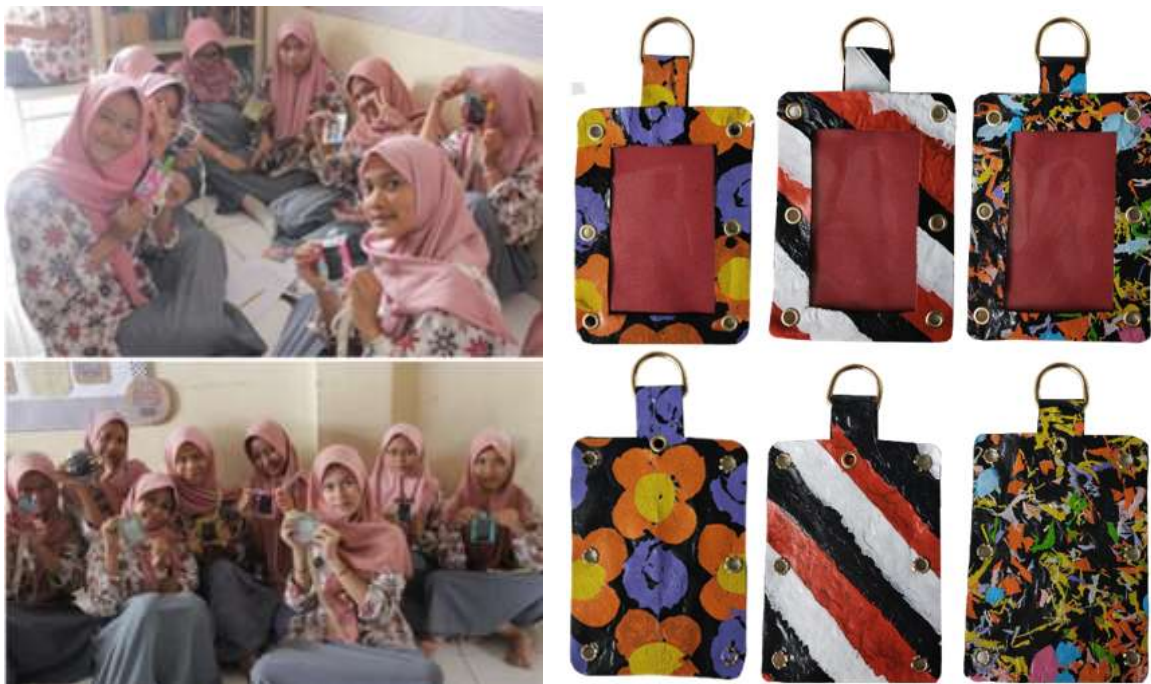
Gambar 10. Hasil eksplorasi warna dengan efek leleh dan bakar yang dihasilkan dari proses pengepresan plastik kresek sebagai elemen visual.

Setelah peserta menyelesaikan pembuatan ID card holder sebagai produk sederhana, evaluasi sumatif dilakukan. Hasil penilaian menunjukkan bahwa sebagian peserta mampu mengeksplorasi warna secara bebas dan tidak ragu untuk menggunakan efek leleh dan bakar yang dihasilkan dari proses pengepresan plastik kresek sebagai elemen visual yang artistik, sebagaimana terlihat pada Gambar 10.