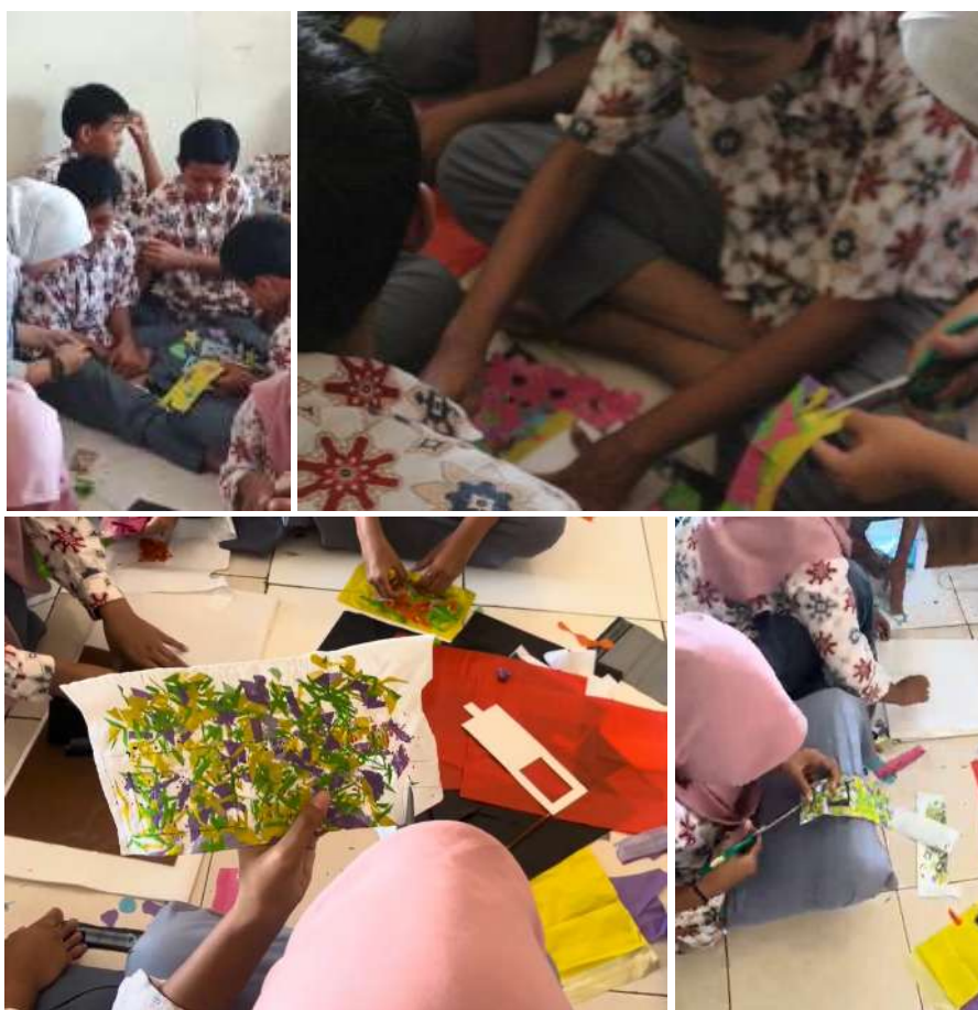
Gambar 8. Peserta melakukan pemotongan lembaran hasil pengepresan sesuai pola cetak.

Selanjutnya, lembaran kresek lalu dipotong sesuai dengan pola yang telah dicetak, seperti terlihat pada Gambar 8. Untuk menjaga ketepatan bentuk dan kerapihan tepi produk, peserta melakukan pemotongan secara hati-hati dan teliti. Tahap ini menghasilkan potongan plastik yang siap pakai untuk dirakit menjadi produk penyimpanan kartu identitas atau ID card. Tahap ini mengharuskan peserta untuk dapat memahami pentingnya presisi bentuk dalam kriya, bahkan ketika mereka menggunakan bahan limbah.