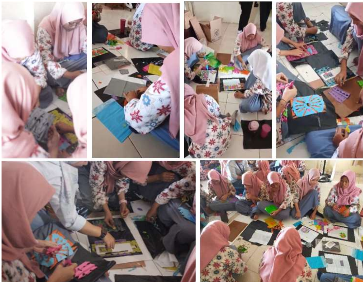
Gambar 5. Peserta menyusun dan mengombinasikan warna untuk membuat lembaran plastik baru.

Tahap eksplorasi warna dilakukan dengan memberikan pemaparan langsung kepada tiap kelompok kecil peserta mengenai prinsip teori warna dan kemungkinan kombinasi warna dalam praktik kriya. Pemaparan tentang teori warna dilakukan tidak terlalu mendalam, tetapi peserta diberikan pemahaman praktis tentang harmoni warna, kontras, dan transparansi sebagai panduan untuk membuat lapisan plastik kresek. Peserta kemudian menggunakan pengetahuan ini untuk membuat kombinasi warna sesuai pilihan masing-masing menjadi lembaran baru yang lebih tebal dibandingkan lembaran plastik kresek biasanya, sebagaimana ditunjukkan Gambar 5. Adanya perbedaan dalam pendekatan visual dan preferensi setiap orang selama proses eksplorasi ditunjukkan oleh variasi susunan warna yang dibuat oleh peserta.