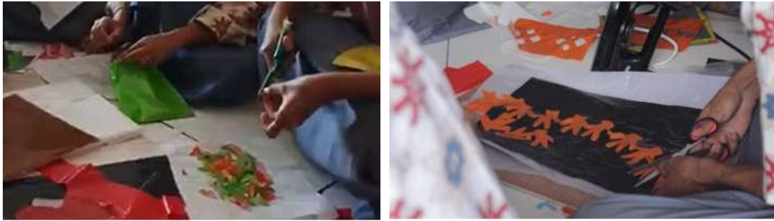
Gambar 4. Tahap pemotongan plastik.

Tahap eksplorasi warna dilakukan dengan memberikan pemaparan langsung kepada tiap kelompok kecil peserta mengenai prinsip teori warna dan kemungkinan kombinasi warna dalam praktik kriya. Pemaparan tentang teori warna dilakukan tidak terlalu mendalam, tetapi peserta diberikan pemahaman praktis tentang harmoni warna, kontras, dan transparansi sebagai panduan untuk membuat lapisan plastik kresek. Peserta kemudian menggunakan pengetahuan ini untuk membuat kombinasi warna sesuai pilihan masing-masing menjadi lembaran baru yang lebih tebal dibandingkan lembaran plastik kresek biasanya, sebagaimana ditunjukkan Gambar 5. Adanya perbedaan dalam pendekatan visual dan preferensi setiap orang selama proses eksplorasi ditunjukkan oleh variasi susunan warna yang dibuat oleh peserta.