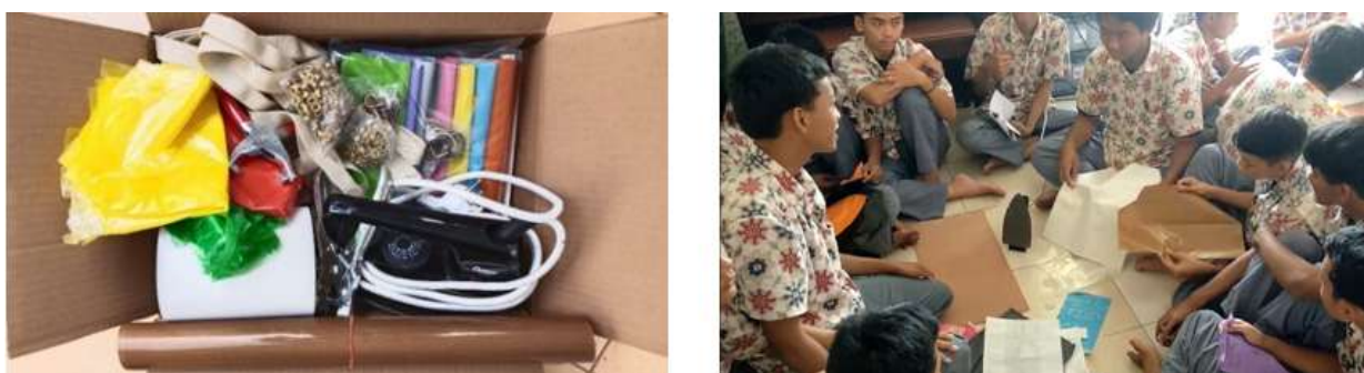
Gambar 3. Pembagian alat dan bahan material untuk digunakan dalam kegiatan praktik

Sesi praktik merupakan bagian penting dari pelatihan kriya karena peserta terlibat langsung dalam pengolahan material limbah plastik kresek. Selama sesi praktik, peserta dibagi menjadi tujuh kelompok untuk mempermudah proses. Setiap peserta diberi beberapa macam plastik kresek sebagai material utama dan bahan pelengkap meliputi kertas teflon, kertas roti, karton dupleks, ring D dan mata ayam. Selain itu, setiap kelompok menerima papan alas pengepresan, setrika, tang pembolong, tang mata ayam sebagai alat praktik yang digunakan secara bergantian, sebagaimana yang ditunjukkan Gambar 3. Pada awal sesi ini, peserta diperkenalkan dengan bahan, alat dan perlengkapan yang digunakan. Perkenalan ini memberikan peserta pemahaman awal tentang alur kerja praktik dan membantu peserta memahami keterkaitan material, alat dan pelengkap.