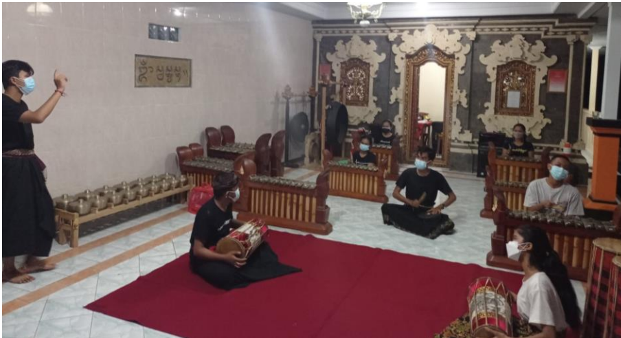
Gambar 1. Pelatihan dengan Metode Fonik

Wiwin Astari, jurnal.isi-dps.ac.id , google scholar , dan lain-lain sesuai dengan kebutuhan masyarakat mitra. Adapun bukti-bukti dari pelaksanaan kegiatan ini, antara lain.