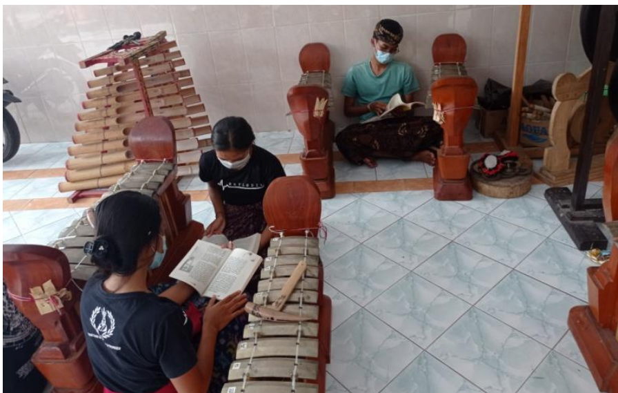
Gambar 2. Penerapan Biblioterapi