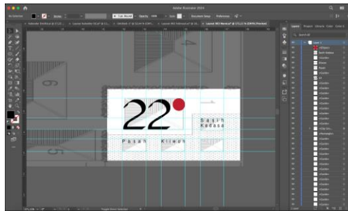
Gambar 2. Grid yang diambil dari denah rumah tradisional

Grid system tidak hanya pola geometris, tetapi juga dapat diadaptasi dari sumber budaya, seperti pola denah rumah tradisional Bali yang mencerminkan harmoni manusia dan lingkungannya. Proses dimulai dengan penelitian pola tradisional melalui referensi visual dan literatur, lalu diterjemahkan ke dalam kerangka digital menggunakan Adobe Illustrator . Grid ini menjadi pedoman dalam menyusun elemen kalender, menciptakan desain yang terstruktur dan beresonansi dengan identitas budaya Bali.