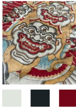
Gambar 6. Color Palette Neo Caka Calendar (Sumber : Dokumentasi Prabawa, 2024)

Dalam perancangan Kalender Caka Bali , penulis menggunakan warna putih, hitam, dan merah sebagai warna utama ( primary colors ). Pemilihan warna ini bertujuan untuk mempertahankan persepsi masyarakat terhadap warna tradisional yang biasanya digunakan dalam kalender Bali, sehingga tetap terasa akrab dan relevan. Selain itu, penulis juga mengambil sampel warna dari lukisan Wayang Kamasan, yang mencerminkan nuansa budaya Bali secara autentik. Menurut Salsabila (2023), warna merek merupakan palet warna yang digunakan secara konsisten dalam visual identity untuk menciptakan kesan yang khas dan membedakan merek dari pesaing. Dalam hal ini, warna putih dan hitam dipilih karena mendukung konsep desain grafis minimalis yang diusung dalam kalender ini. Warna putih mencerminkan kesederhanaan dan keterbacaan, sementara warna hitam memberikan kesan tegas dan elegan.