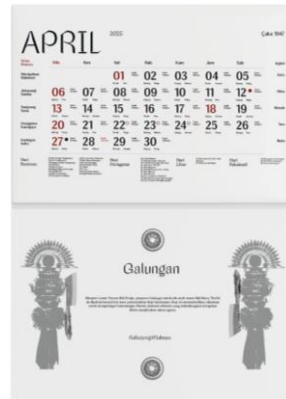
Gambar 8. Color Palette Neo Caka Calendar

Kalender yang dirancang memiliki ukuran 36 x 28 cm, sebuah dimensi yang dipilih dengan cermat untuk mencapai keseimbangan optimal antara fungsionalitas dan estetika. Ukuran ini memberikan ruang yang cukup untuk elemen visual, seperti gambar dan ilustrasi, tanpa mengorbankan keterbacaan informasi penting, seperti tanggal dan catatan. Dengan desain yang proporsional, kalender ini tidak hanya berfungsi sebagai alat untuk mengatur waktu, tetapi juga sebagai elemen dekoratif yang menarik perhatian.