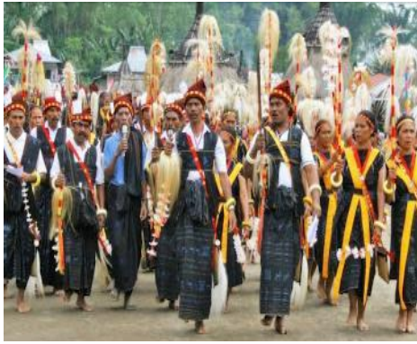
Gambar 1. Desain Brief Tradisi Reba

Riset dan sumber seni fesyen ( Research and sourcing of art fashion ), merupakan tahap lanjutan setelah awal penentuan ide. Kemudian dilakukan riset lebih dalam tentang tradisi Reba dan mencari unsur-unsur dan makna tertentu yang terkandung didalamnya. Output dari tahap ini berupa mindmapping yang akan digunakan pada tahap selanjutnya untuk memudahkan dalam memilih concept list serta memilih kata kunci/ keywords yang akan menjadi acuan dalam perancangan desain busana. Keywords yang terpilih yaitu ubi, bambu, magis, tempurung kelapa, dan tuba. Perpaduan gaya exotic dramatic , difungsikan untuk menambah kesan etnik dan unik dalam sebuah busana. Exotic Dramatic merupakan gaya berbusana dengan sentuhan etnik namun dikemas dalam suatu trend fashion . Exotic Dramatic adalah gaya yang unik, khas, dan original (Indrianti, 2017:44). Busana bergaya exotic dramatic umumnya memakai bahan-bahan tradisional seperti tenun, songket, batik. Aksesoris yang dipergunakan pun terbuat dari tembaga, kayu, velvet, dan bahan unik lainnya. warna yang dapat memberikann kesan dramatic seperti merah, hitam, gold, silver, dan coklat.