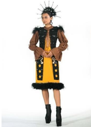
Gambar 7. Busana Semi Haute Couture Sumber : Pushpa, 2022

Elemen bidang terdapat pada bagian tampak bawah outer berbentuk persegi panjang yang sejajar. Elemen tekstur yaitu pada bagian kain yang digunakan seperti kain tenun ikat Ngadha dan kain cotton crl aprilia . Elemen warna yang digunakan yaitu warna sekunder, netral dan tersier seperti pigmen warna kuning, hitam dan coklat pada textile . Prinsip irama terdapat pada pengulangan detail teknik manipulasi ui pada outer bagian sisi kanan kiri