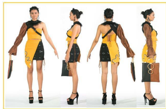
Gambar 4. Final Collection Busana Ready to Wear Deluxe

yang jika dilanggar membawa malapetaka, sedangkan mata ayam dari implementasi bambu yang apabila batangnya dipotong menyerupai sebuah cincin dan juga berbuku-buku yang diterapkan pada lengan yang dikerut. Sedangkan tempurung kelapa diimplementasikan pada satu lengan sebelah kanan lalu menggunakan pigmen warna coklat pada textile dan pemilihan bahan yang memiliki tekstur serabut kelapa yang masih menempel pada tempurung kelapa. Serta penerapan senjata tuba di implementasikan dengan mempergunakan renda bulu ostrich warna hitam pada bagian kerah tegak sehingga memberi kesan penegasan.