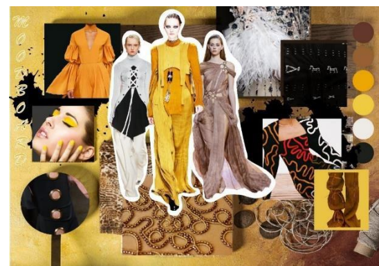
Gambar 3. Moodboard Tradisi Reba

Menarasikan ide seni fesyen ke dalam visualisasi 2D atau 3D ( Narrating of art fashion idea by 2d or 3d visualization ), merupakan tahap lanjutan yang memberikan petunjuk dasar dan menentukan tujuan atau teknik yang akan ditempuh dalam memulai perwujudan karya busana Sili Uwi . Dalam tahap ini menghasilkan output desain pengembangan ( design development ) berupa sketsa alternatif gagasan dalam bentuk desain sketsa ilustrasi mode dan gambar teknik. Desain adalah suatu benda yang dibuat berdasarkan susunan garis, bentuk, warna dan tekstur (Widya dalam Yuliati, 2020:178).