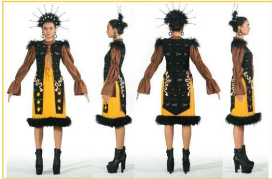
Gambar 5. Final Collection Busana Semi Haute Couture

karya busana bagian lengan dan kerah empergunakan pigmen warna coklat pada textile yang bertekstur seperti serabut kelapa yang masih menempel pada tempurung kelapa, tempurung kelapa simbolis dari Sili yang merupakan pionir pertama yang melakukan tradisi/ upacara Reba. sedangkan Tuba diimplementasi pada karya busana dengan menggunakan renda bulu ostrich warna hitam pada bagian bahu dan bagian bawah midi dress yang di mix menggunakan tulle hitam.