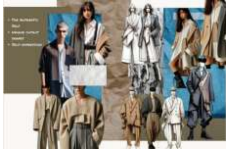
Gambar 3. Trendn Fashion

sebagai pemicu pembuatan film ini, adalah langkah pertama dalam analisis estetika. Proses dimulai dari menganalisis dan melakukan research terhadap beberapa aspek pada bidang fashion , seperti trend fashion , color research , designer research , dan fabric research . Setelah aspek tersebut didapatkan Langkah berikutnya wajib membuat collection mapping .