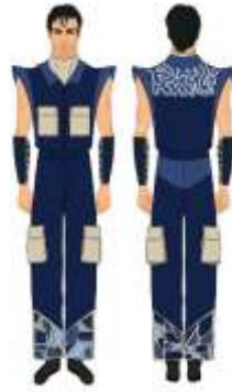
Gambar 9. Desain Ready To Wear Terpilih

Moodboard berfungsi sebagai dasar untuk langkah-langkah yang terlibat dalam pembuatan desain 2D, di mana riset visual dilakukan untuk memeriksa tekstur, bentuk, dan proporsi. Langkah ini menerjemahkan konsep ke dalam representasi visual yang konkret. Membuat sketsa 2D untuk setiap desain fesyen, menampilkan siluet, detail motif, dan kombinasi warna. Memodelkan ilustrasi ke dalam bentuk 3D digital untuk menganalisis proporsi, keseimbangan visual, dan tampilan kain saat dikenakan.