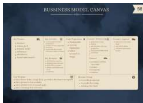
Gambar 16. Bussiness model canvas

Baik sumber daya manusia skala kecil maupun besar yang digunakan dalam proses produksi menjadi fokus tahap ini. Sumber daya ini mencakup desainer, produsen, dan penjahit. Keberhasilan seluruh proses sangat tergantung pada kemampuan desainer dalam menempatkan diri dengan tepat serta komitmennya terhadap setiap langkah yang diambil