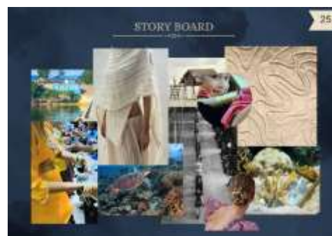
Gambar 8. Story Board