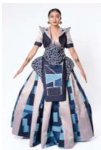
Gambar 19. Desain semi couture