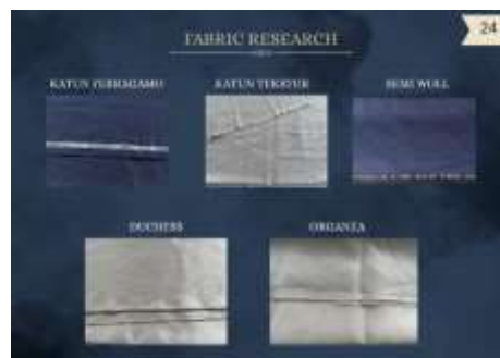
Gambar 6. Fabric research