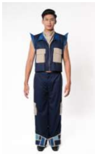
Gambar 17. Desain ready to wear