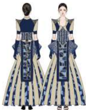
Gambar 11. Desain Semi Couture Terpilih