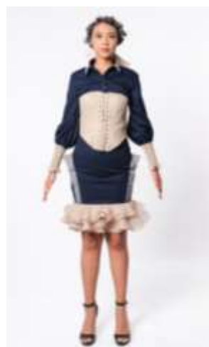
Gambar 18. Desain ready to wear deluxe