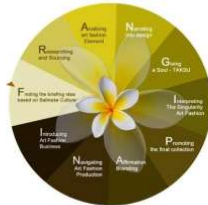
Gambar 1 FRANGIPANI, THE SECRET STEPS OF ART FASHION Sumber: Sudharsana, 2016

Berikut 10 tahapan proses desain fashion FRANGIPANI :