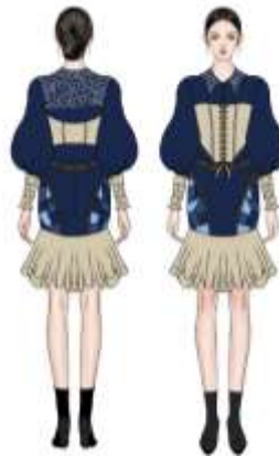
Gambar 10. Desain Ready To Wear Deluxe Terpilih