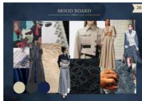
Gambar 7. Mood Board