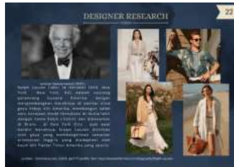
Gambar 5. Designer research