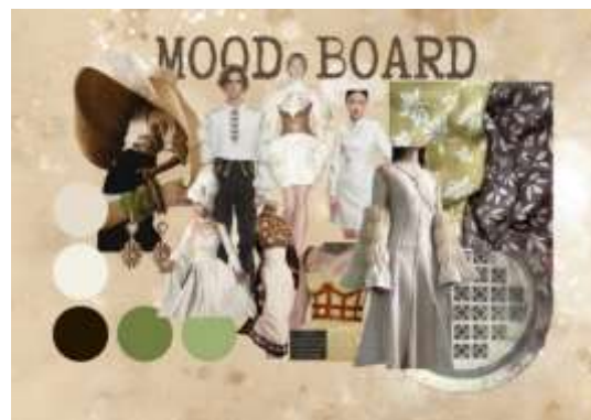
Gambar 7. Mood Board