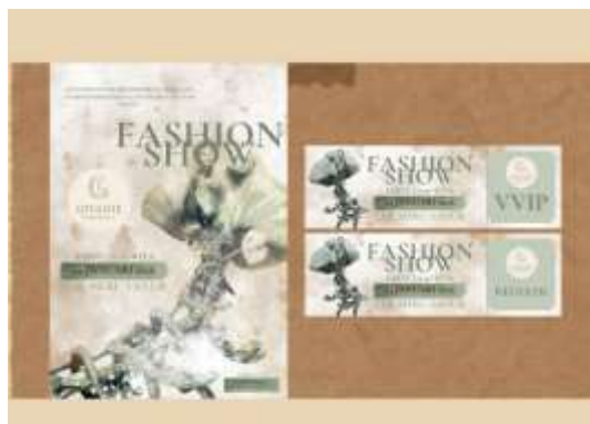
Gambar 11. Flyer dan Ticket Fashion Show