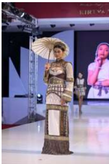
Gambar 13. Wujud karya busana Ready to Wear Deluxe

Karya busana Semi Couture dalam koleksi Bayang Langit Loka dirancang sebagai pengembangan tingkat lanjut dengan penekanan pada kompleksitas desain, detail konstruksi, serta eksplorasi teknik kriya tekstil yang lebih intensif. Busana ini terdiri atas lima bagian utama, yaitu bustier, bolero, lengan, korset, dan rok. Material yang digunakan didominasi oleh kain cotton twill 20's suede yang memiliki karakter kokoh dan terstruktur, sementara pada bagian lengan digunakan kain cotton slub untuk menghadirkan kontras tekstur yang lebih ringan dan dinamis. Bustier dirancang dengan bentuk bustier klasik yang mengikuti lekuk tubuh, dilengkapi aksesoris cilpacastra pada bagian dada sebagai titik fokus visual. Seluruh penerapan cilpacastra pada busana ini diperkaya dengan teknik lukis prada serta aplikasi payet yang disesuaikan secara proporsional untuk mempertegas nilai artistik tanpa menghilangkan keseimbangan desain. Bolero dirancang dengan kerah Shanghai dan bagian pundak hingga dada atas divisualisasikan sebagai interpretasi struktur sumur langit Gedung Candra Naya melalui manipulasi bentuk geometris. Struktur ini menyambung dari bagian pundak ke area depan dan belakang, dengan potongan terbuka yang menampilkan bustier di bagian dalam, serta potongan pinggiran melengkung yang menghadirkan kesan anggun dan dinamis.