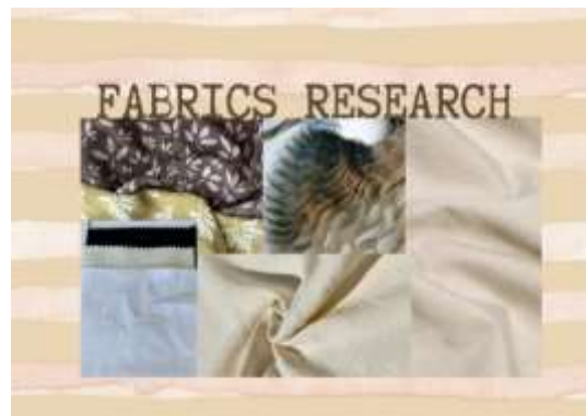
Gambar 5. Fabrics Research