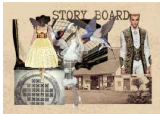
Gambar 6. Story Board