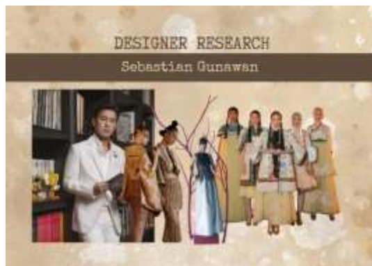
Gambar 4. Designer Research