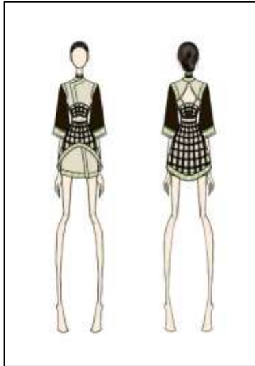
Gambar 8. Desain Terpilih Ready to Wear