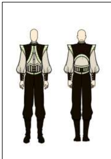
Gambar 9. Desain Terpilih Ready to Wear Deluxe