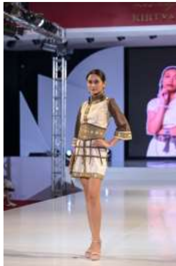
Gambar 12. Wujud karya busana Ready to Wear

yang merepresentasikan jendela bulan, diciptakan dengan teknik cilpacastra dan dipertegas teknik prada, sehingga menegaskan narasi akulturasi budaya dalam karya Bayang Langit Loka .