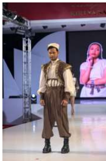
Gambar 13. Wujud karya busana Ready to Wear Deluxe (Sumber: Lavani, 2025)

Karya Busana Ready to Wear Deluxe dirancang sebagai pengembangan dari busana Ready to Wear dengan penekanan pada eksplorasi detail, teknik, dan kualitas visual yang lebih eksklusif. Busana Bayang Langit Loka pada kategori ini dirancang sebagai representasi maskulin yang elegan melalui pendekatan siluet klasik. Busana terdiri dari empat bagian yaitu, kemeja, celana, vest , dan korset, yang dirancang sebagai satu kesatuan. Karya ini menggunakan perbedaan material antara kemeja dan bagian busana lainnya. Kemeja menggunakan kain cotton slub yang memiliki karakter serat timbul dengan tekstur tidak rata, sehingga menghadirkan kesan ringan, dan alami. Karakter material ini mendukung siluet kemeja berlengan bishop yang terinspirasi dari gaya busana pria masa kolonial Belanda. Penerapan kerah Shanghai menjadi elemen visual yang merepresentasikan pengaruh kebudayaan Tionghoa, sekaligus mempertegas narasi akulturasi budaya yang menjadi dasar penciptaan karya.