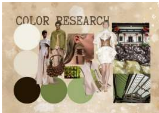
Gambar 3. Color Research