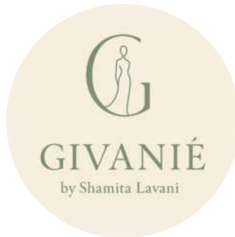
Gambar 11. Logo Brand