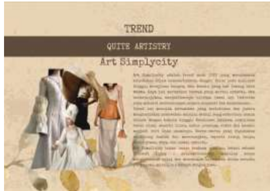
Gambar 2. Trend Fashion

Tahap ketiga, yaitu analisa estetika yang berfungsi untuk menggali nilai-nilai visual yang terkandung dalam sumber inspirasi, sehingga dapat diterjemahkan secara tepat ke dalam bentuk karya busana. Penciptaan karya busana Bayang Langit Loka , tahap ini menjadi landasan utama dalam memahami dan mengolah elemen arsitektur Gedung Candra Naya.