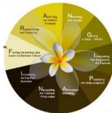
Gambar 1. Metode Frangipani

dijadikan ilustrasi diagram Frangipani yang terdiri dari dua Bunga dengan jumlah masing masing 5 kelopak bunga. Kelopak-kelopak tersebut melambangkan sepuluh tahapan dalam proses perancangan produk fesyen global. Dengan berlandaskan metode ini, proses perancangan karya busana dengan ide pemantik Gedung Candra diciptakan dengan terstruktur dan berkesinambungan. Metode ini menuntun perancang melalui sepuluh tahapan yang saling terhubung, mulai dari menentukan ide dasar hingga refleksi akhir, yang diibaratkan sebagai siklus kelopak bunga jepun yang tumbuh dan mekar secara otomatis.