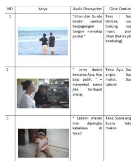
Gambar 2. Contoh AD dan CC

Audio description dibuat melalui banyak riset dikarenakan tidak banyak production house ataupun jasa pembuatan audio description yang sesuai dengan standar film untuk dapat dinikmati oleh disabilitas. Riset yang dilakukan tentunya dengan menemui beberapa filmmaker yang menerapkan audio description pada filmnya, selain itu, melakukan riset dengan menemui tokoh yang memahami dan memiliki kredibilitas tinggi dalam merangkai kata per kata yang mampu untuk dipahami oleh teman-teman Netra dan tuli.