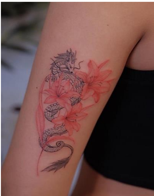
Gambar 2. Karya Berjudul "Keanggunan Melingkari Kekuatan"

"Lioness Harmony" menghadirkan kejayaan dalam tattoo outline yang tanpa henti. Singa yang gagah beriringan dengan keanggunan sang dewi, garis-garis halus menyatukan keduanya dalam harmoni visual. Tatapan tajam singa dan keelokan wanita bersatu dalam karya ini, menciptakan kesan kesatuan yang mengagumkan. memancarkan keanggunan ikan, tetapi juga merayakan hubungan yang erat dan harmonis ini menceritakan kisah tentang keharmonisan yang dapat tercipta ketika kekuatan alam yang berbeda bersatu dalam satu tarian keindahan di kulit.