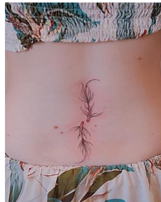
Gambar 4. Karya Berjudul "Dance of Pisces"

"Naga dan Bunga" adalah karya tattoo yang menawan, menampilkan tarian indah antara keanggunan naga dan kecantikan bunga. Dengan lekukan yang indah, naga memeluk dengan lembut bunga yang mekar di kulit. Tattoo ini mengekspresikan harmoni antara kekuatan yang elegan dan kelembutan yang memikat. Sorot mata naga penuh kebijaksanaan dan keingintahuan, menciptakan hubungan emosional dengan bunga yang dilingkupinya. Detail yang tajam pada sisik naga dan kelopak bunga yang halus menambah dimensi pada karya ini, sementara warna-warna yang hidup memancarkan keindahan dan vitalitas. "Naga dan Bunga" menjadi simbol kesatuan antara dua kekuatan yang berbeda: naga sebagai simbol kekuatan dan bunga sebagai simbol kehidupan dan keindahan. Tattoo ini menceritakan kisah tentang keharmonisan yang dapat tercipta ketika kekuatan alam yang berbeda bersatu dalam satu tarian keindahan di kulit.