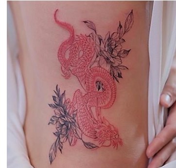
Gambar 3. Karya Berjudul "Tarian Keindahan di Kulit"

Karya tattoo yang memukau dengan perpaduan tak terduga antara kekuatan naga yang melingkari lembut bunga tulip. Dengan perpaduan warna merah yang kontras dan detil yang tajam di sertai outline naga berwarna hitam, tattoo ini menciptakan keseimbangan unik antara keanggunan dan kelembutan, menggambarkan kisah tentang kekuatan yang melindungi keindahan yang rapuh.