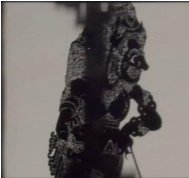
Gambar 2. Tokoh Sri Rahwana Dalam Pementasan Teater Inovatif Satya Semara

Pengelolaan media dan prangkat artistik juga tampak melalui adegan Tokoh Sri Rahwana yang divisualisasikan dengan penguatan ekspresi dramatik, tata cahaya, dan komposisi visual untuk menegaskan karakter antagonistik sekaligus kompleksitas psikologis tokoh dalam konflik cerita, serta adegan igel kayonan (tairan kayonan) difungsikan sebagai medium transisi dramatik sekaligus simbol keseimbangan kosmis yang mempertahankan idiom estetik pedalangan Bali di tengah eksplorasi visual pertunjukan inovatif.