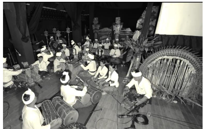
Gambar 4. Visual Komposisi Letak Musik Iringan Satya Semara

Kolaborasi tersebut melibatkan aktor teater, pemain wayang, penata musik, penata artistik, penata pencahayaan, serta tim pendukung teknis lainnya yang berperan dalam membangun kesatuan pertunjukan, sebagaimana di tunjukkan melalui dokumentasi iringan pertunjukan Satya Semara berikut,