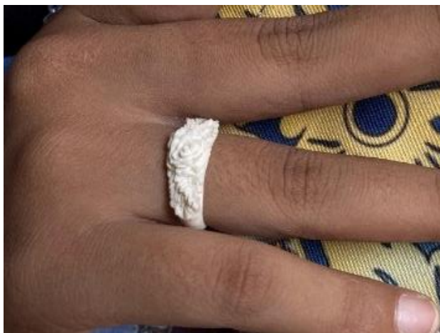
Gambar 6. Cincin Ukuran: Diameter 2 cm Bahan: Tulang Sapi Teknik: ukir dengan alat foreedom

Cincin adalah aksesoris yang memiliki ornamen dengan bentuk bunga mawar sedang mekar dihiasi daun pada kedua sisinya, penulis mengkombinasikan aksesoris dengan busana yang dimiliki oleh PT. Rumah Imajinasi Kirana karena pada bagian jari tidak terjamah oleh busana jadi kurang sempurna oleh karena itu penulis menciptakan aksesoris cincin untuk mewujudkan karya fashion yang sempurna.