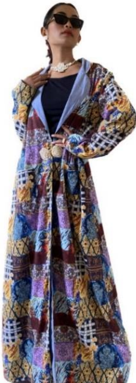
Gambar 8. Kombinasi Aksesoris dengan Fashion

Karya aksesoris fashion menunjukkan keseluruhan perpaduan antara aksesoris Bunga Mawar berbahan tulang dengan busana/karya fashion yang diciptakan PT. Rumah Imajinasi Kirana. Karya aksesoris melengkapi busana, seperti contoh pada bagian leher, bagian jari, bagian pergelangan tangan, yang sebelumnya tidak menggunakan aksesoris dengan perpaduan ini memakai aksesoris berbahan dasar tulang dengan tema bunga mawar dan menerapkan konsep harmoni. Dari proses ini terwujudlah sebuah keharmonisan antara aksesoris dan busana, yang saling melengkapi sehingga menjadikan sebuah karya fashion yang sempurna.