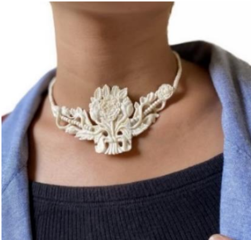
Gambar 3. Kalung Ukuran: Tinggi 5,6 cm x Lebar 11 cm x Lingkar 57 cm Bahan: Tulang Sapi Teknik: ukir dengan alat freedom

Karya kalung dengan judul Kasih Sayang yang diperagakan oleh model dikombinasikan dengan busana milik PT. Rumah Imajinasi Kirana terlihat memiliki perpaduan yang harmonis. Karya tersebut memiliki ornamen buket bunga mawar, dihiasi bunga mawar dari masih kuncup, sedang mekar, dan sudah layu dengan hiasan pita yang mengikat bunga mawar tersebut, dipadukan dengan busana dengan gambar ilustrasi yang beraneka ragam dengan menerapkan warna cerah dan menggunakan teknik digital printing.