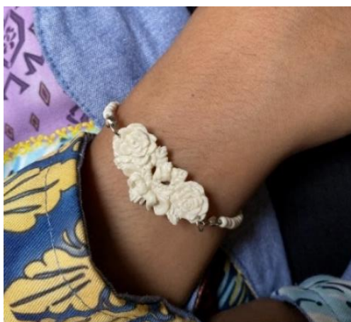
Gambar 7. Gelang Ukuran: Tinggi 2,3 cm x Lebar 3,7 cm x Lingkar 15 cm. Bahan: Tulang Sapi Teknik: ukir dengan alat foreedom

Aksesoris gelang di atas berjudul Buket Bunga Mawar dengan ornamen dua bunga mawar yang sedang mekar, tiga bunga mawar masih kuncup dan terdapat pita yang menggambarkan sebagai pengikat bunga mawar tersebut, gelang ini dikombinasikan dengan busana milik PT. Rumah Imajinasi Kirana dengan