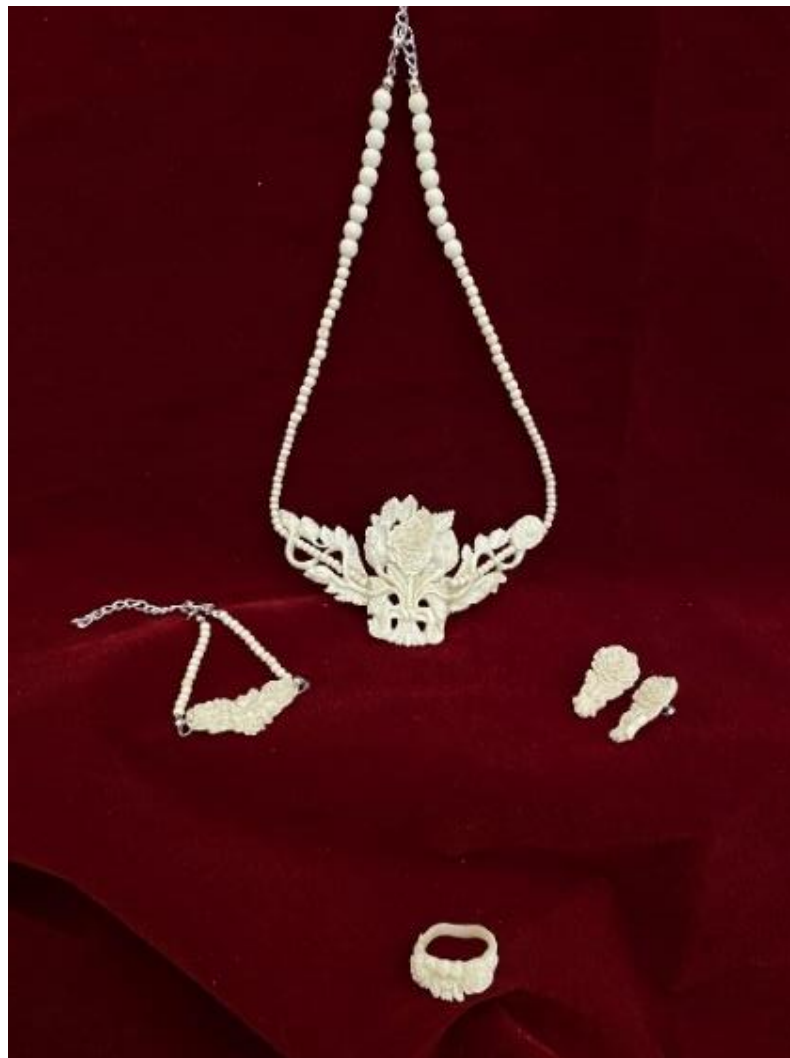
Gambar 2. Set Aksesoris Kasih Sayang