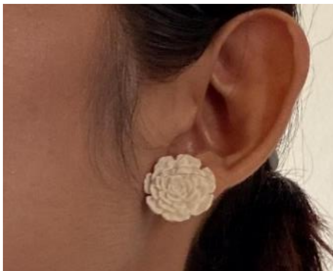
Gambar 4. Subeng Ukuran: Tinggi 4 cm x Lebar 2,8 cm Bahan: Tulang Sapi Teknik: ukir dengan alat freedom

Subeng ini memiliki ornamen bunga mawar yang sedang mekar terlihat sederhana dan dipadukan dengan busana milik PT. Rumah Imajinasi Kirana dengan motif busana yang beragam dan ada bagian busana yang polos tanpa motif. Antara subeng dan busana yang dipadukan dapat menampilkan perpaduan yang harmonis.