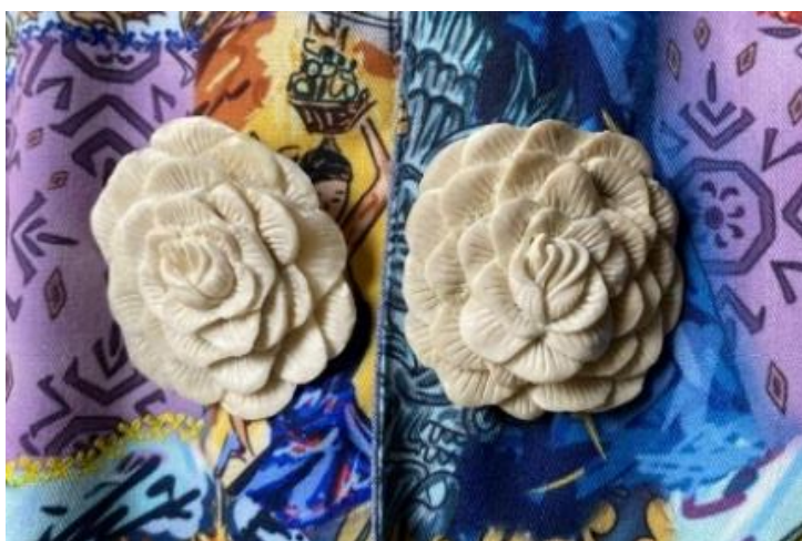
Gambar 5. Kancing Baju Ukuran: Tinggi 4 cm x Lebar 2,8 cm Bahan: Tulang Sapi Teknik: ukir dengan alat freedom

Kancing baju merupakan aksesoris yang berbentuk bundar dipasangkan dengan lubang kancing untuk menyatukan dua helai kain yang bertumpukan atau sebagai hiasan yang mendukung sepenuhnya sebuah fashion. Kancing baju berfungsi sebagai hiasan dengan ornamen bunga mawar sedang mekar