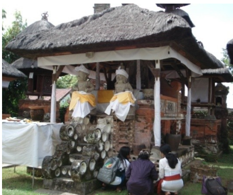
Gambar 1: Pelinggih Bale Panca

Pelinggih yang ada pada Pura Agung Puri Satria Denpasar ini sebelumnya sudah terdapat berbagai macam piring porselen keramik dengan berbagai ornamen dan motif yang sudah dipasang pada jaman kerajaan dan memiliki estetika yang cukup tinggi. Sampai sekarang keramik porselen yang ditempel pada Pura masih terpelihara dengan baik dan dirawat oleh Puri. Berbagai jenis dan ukuran keramik porselen yang ditempel seperti piring, lepek, jembung, dan cawan yang yang diatur sedemikian rupa, sehingga ornamen sangat menyatu dengan bentuk bangunan.