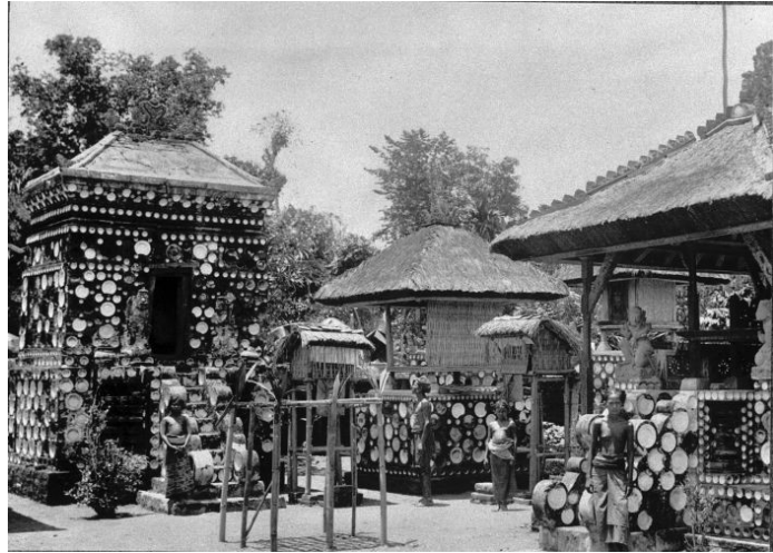
Gambar 10: Pelinggih Bhatara Batukaru th. 1921