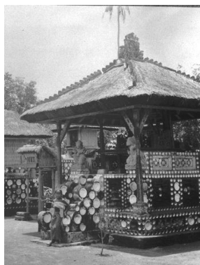
Gambar 2: Pelinggih Bale Panca