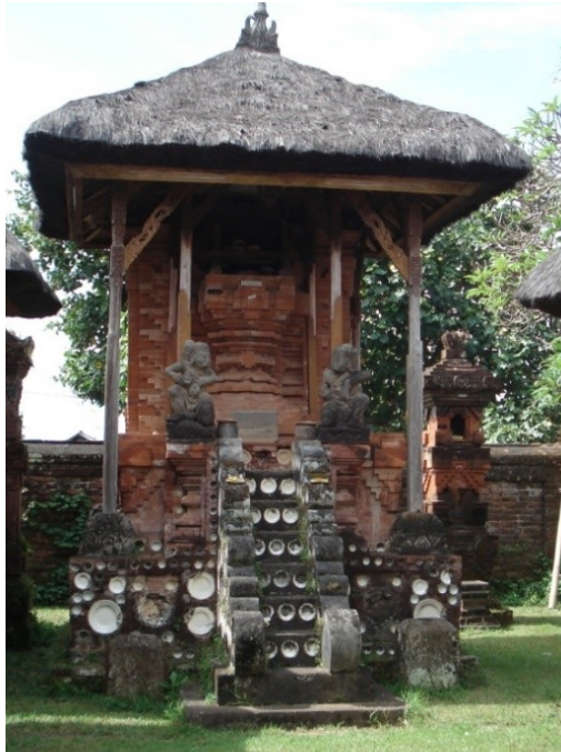
Gambar 4: Pelinggih Bhatara Brahma

cerita. Penulis mengamati bahwa keunikan pura muncul dari pemakaian keramik porselen yang menghias pelinggih-pelinggih tersebut. Bentuk bangunan dan ornamen sangat khas dan berbeda dengan bentuk Pura-pura lainnya. Sebuah karya seni budaya yang sangat unik dan khas dan perlu dijaga dan dilestarikan. Bangunan suci yang memiliki nilai sejarah yang sangat kuat, yang perlu dirawat dan dikembangkan dengan baik untuk menunjang pura sebagai obyek kunjungan wisata.