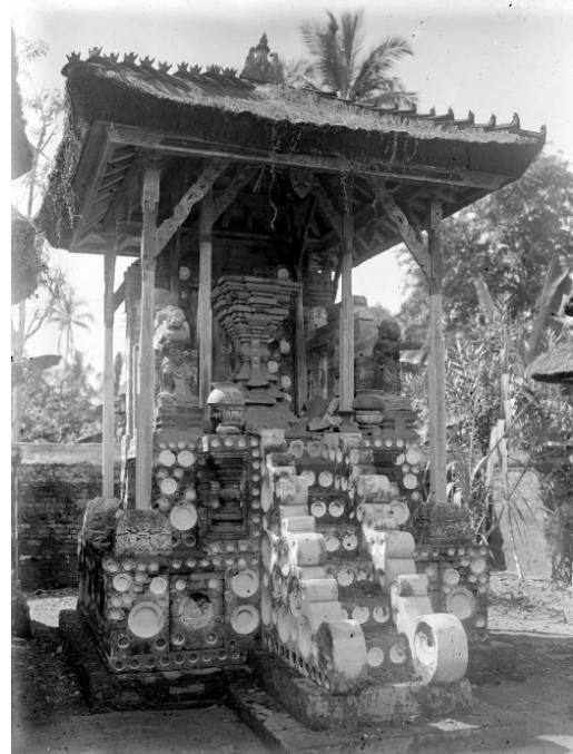
Gambar 5: Pelinggih Bhatara Brahma th. 1921

Seperti pelinggih sebelumnya, Pelinggih Bhatara Brahma tahun 2012 masih menunjukkan keasliannya, diantaranya masih terlihat menggunakan porselen lama sebagai ornamen walaupun jumlahnya telah berkurang. Pada bagian-bagian atas bangunan sudah tidak terlihat menggunakan ornamen porselen. Patung dan posisinya juga tampak telah mengalami perubahan, demikian juga pada bagian atapnya terlihat tidak menggunakan pemugbug , tiang, sendi, penukub , dan bagian-bagian lain, sedangkan bagian bawah seperti undagan terlihat tetap tidak mengalami perubahan. Hal ini menunjukkan perbaikan yang dilakukan tahun 1964 hanya dilakukan pada bagian tengah sampai keatas bangunan dengan sedikit perubahan bentuk namun masih tetap menggunakan bata merah.