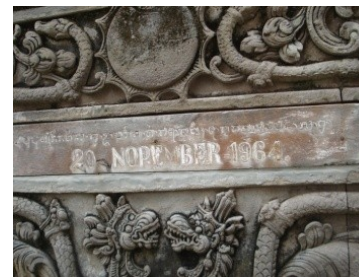
Gambar 3: Tulisan pada aling-aling yang menunjukkan pemugaran pura pernah dilakukan tahun 1964

Gambar di atas menunjukkan perbandingan Pelinggih Bale Panca yang didokumentasikan pada waktu yang berbeda (1921 dan 2014). Bangunan lama (tengah) dipenuhi dengan ornamen porselen dalam jumlah yang banyak, sedangkan pada gambar yang diambil tahun 2014 pemakaian ornamen porselen terlihat jumlahnya berkurang. Atap bangunan juga mengalami perubahan tanpa pemugbug dan penukub . Menurut sumber di puri dan data tulisan yang tertempel pada aling-aling pura, secara keseluruhan pura ini pernah dipugar tahun 1964. Sehingga terjadi perubahan-perubahan misalnya pemakaian piring sebagai hiasan berkurang disamping karena pecah juga karena faktor style bangunan berubah walaupun tidak secara keseluruhan. Kondisi keramik porselen pada bangunan-bangunan peinggih pada kompleks bangunan pura ini terlihat kurang terawat, banyak telah terlepas dari tempatnya dan hilang tanpa ada