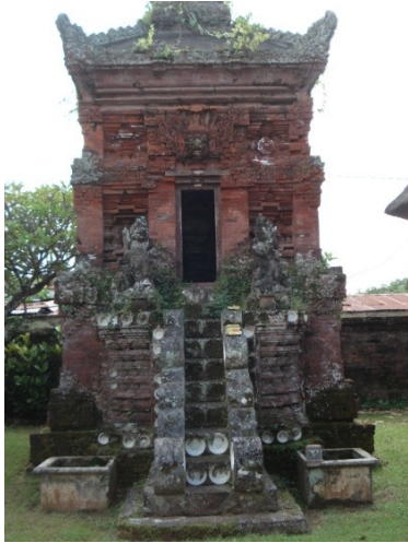
Gambar 9: Pelinggih Bhatara Batukaru