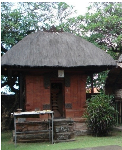
Gambar 6: Pelinggih Batu Klotok th. 1921

Seperti pelinggih sebelumnya, Pelinggih Bhatara Brahma tahun 2012 masih menunjukkan keasliannya, diantaranya masih terlihat menggunakan porselen lama sebagai ornamen walaupun jumlahnya telah berkurang. Pada bagian-bagian atas bangunan sudah tidak terlihat menggunakan ornamen porselen. Patung dan posisinya juga tampak telah mengalami perubahan, demikian juga pada bagian atapnya terlihat tidak menggunakan pemugbug , tiang, sendi, penukub , dan bagian-bagian lain, sedangkan bagian bawah seperti undagan terlihat tetap tidak mengalami perubahan. Hal ini menunjukkan perbaikan yang dilakukan tahun 1964 hanya dilakukan pada bagian tengah sampai keatas bangunan dengan sedikit perubahan bentuk namun masih tetap menggunakan bata merah.