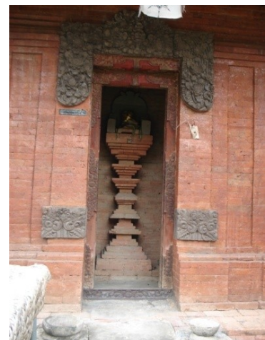
Gambar 8: Pelinggih Batu Klotok