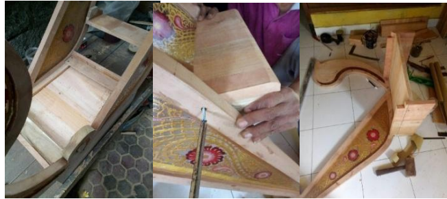
Gambar 14 Judul: Perakitan Meja Belajar Tahun 2021

menyebabkan retak dan paku diganti menjadi baut ulir karena bagian meja yang terdapat resin sangat rawan pecah dan berikut dibawah ini merupakan gambar proses perakitan meja belajar.