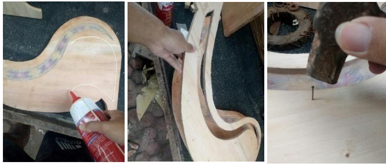
Gambar 9 Judul: Penempelan Dokumentasi: Kadek Angga Putra Tahun 2021

Setelah selesai perakita, berikut gambar no 10 dibawah ini merupakan hasil cor dengan permukaan resin lebih rendah.