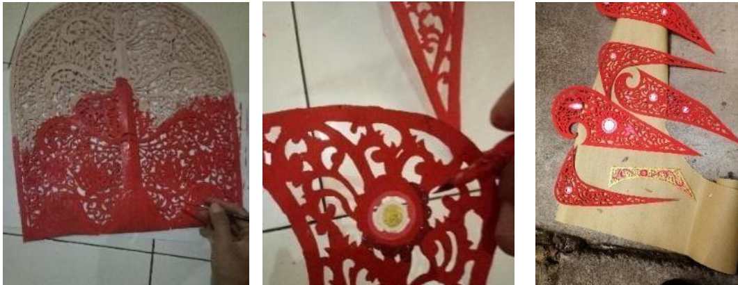
Gambar: 5 Judul: Proses pengecatan Dokumentasi: Kadek Angga Putra, Tahun 2021

Tahap pewarnaan pertama adalah pemberian warna dasar yang bertujuan untuk meningkatkan kecerahan warna pada olesan berikutnya. Setelah pemberian warna dasar, dilanjutkan pada tahapan menyungging warna di beberapa bagian seperti bunga ,batun poh dan dilanjutkan mengoleskan warna emas pada bagian yang tidak disungging. Setelah selesai di warnai, tahap terakhir adalah penjemuran agar cat kering dan kadar air dalam tatakan berkurang. Setelah tatakan selesai, dilanjutkan ke tahap pengecoran. Berikut dibawah ini merupakan proses pewarnaan tatakan.