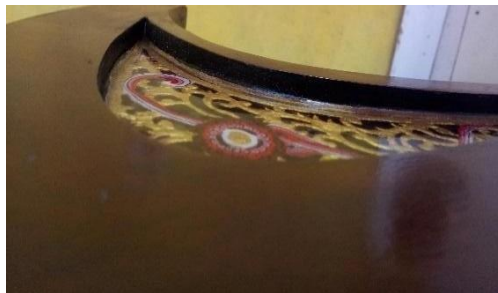
Gambar: 10 Judul: Hasil Pengecoran Tahun 2021

Setelah selesai perakita, berikut gambar no 10 dibawah ini merupakan hasil cor dengan permukaan resin lebih rendah.