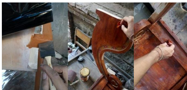
Gambar 15 Judul: Finishing Mowilex 502 Tahun 2021

Tahapan finishing pencipta menggunakan bahan Mowilex. Selain itu bahan Mowilex 502 ini dapat kering tanpa dijemur langsung dibawah sinar matahari, menggunakan campuran air sehingga tidak memiliki bau menyengat seperti bahan finishing yang menggunakan thinner . Untuk pengaplikasian pada kayu, setelah melalui proses pengamplasan pada tahap ini Mowilex langsung di oleskan pada permukaan kayu. Setelah kering permukaan kayu di amplas kembali menggunakan amplas air grit 1500 dengan membasahi amplas terlebih dahulu dengan air kemudian permukaan kayu di gosok sampai permukaan halus. Berikut dibawah ini merupakan proses finishing kursi dan meja belajar menggunakan Mowilex 502.