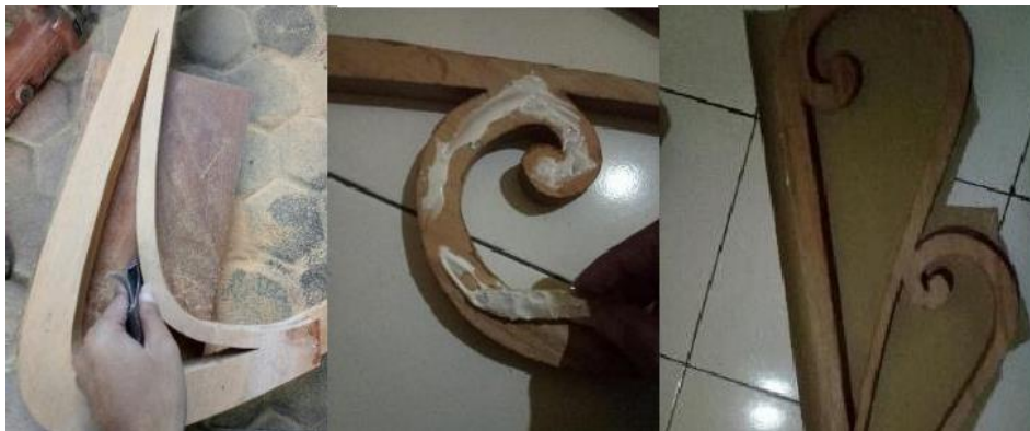
Gambar 6 Judul : Pengamplasan

Tahap awal sebelum dilakukannya pengecoran yaitu pengamplasan yang bertujuan meratakan permukaan kayu. Pada tahap ini pencipta menggunakan amplas kain grit 240 dan setelah itu proses penempelan dasar coran menggunakan karton. Pada tahap penempelan koran, pencipta melapisi lem fox pada bagian bawah kayu kemudian ditempelkan pada karton dan di diamkan sampai lem kering. Berikut dibawah ini merupakan proses dari penjelasan diatas.