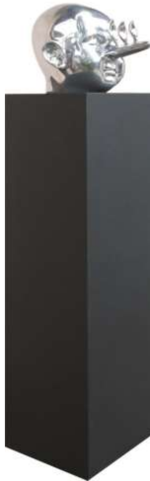
Gambar 2. “Menanam Kebohongan” Media: Aluminium, Batu Candi. 38cm x 48cm x 85cm.