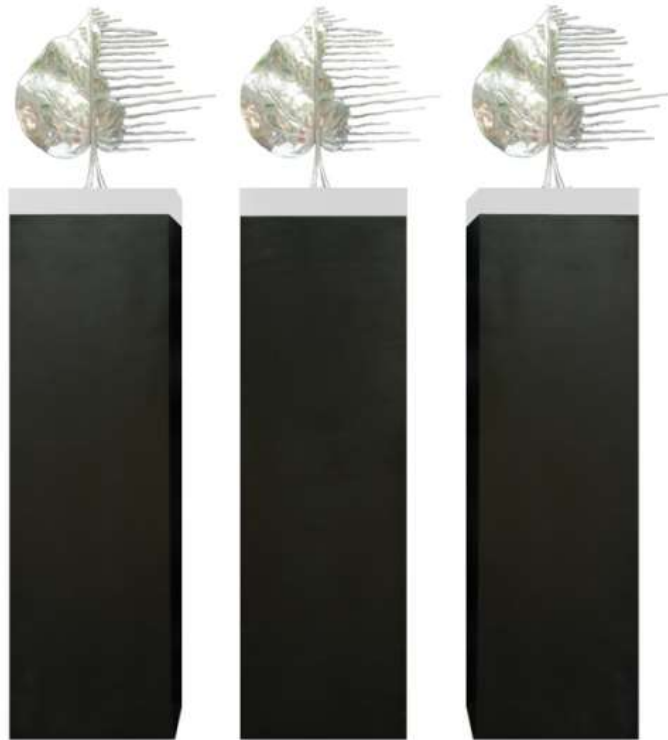
Gambar 1. “Yang Terhempas Waktu” Media: Aluminium, Kayu Suar. 30cm x 30cm x 142cm (Tiga Buah).

Karya yang pertama berjudul “ Yang Terhempas Waktu ” menampilkan bentuk deformatif dari tiga helai daun bodhi/ ancak , dimana separuh bagian dari daun ini dibuat sobek yang hanya menyisakan urat-urat daun yang dibuat menjuntai memanjang secara horizontal. Secara estetik menampilkan kesan irama dan gerak yang dinamis yang memperlihatkan unsur contras yang kuat, dimana pada salah satu bagian dari daun menampilkan bidang yang halus berupa daun bodhi/ ancak yang utuh, di salah satu bagian menampilkan bentuk yang nampak dinamis. Hal ini juga menghadirkan komposisi asimetris pada karya ini, yakni antara daun yang utuh dan daun yang sobek. Karya ini dibuat dengan teknik cor dengan media aluminium, serta menggunakan finishing slab dan clear . Warna pada karya ini adalah warna silver yang mengkilat, hal ini bertujuan agar karya ini terlihat natural.