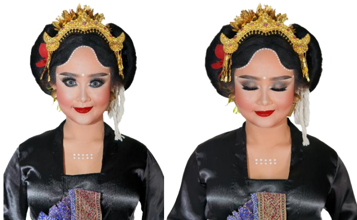
Gambar 3. Tata Rias Karya Tari Pilahing Watu

Dramaturgi (1988) oleh Harimawan, tata rias adalah seni menggunakan bahan-bahan rias untuk merubah bentuk wajah alamiah menjadi artistic . Tata rias pertunjukan bukan tata rias sehari-hari, sehingga harus menyesuaikan tema pertunjukan yang akan dibawakan. Selain itu tata letak penari dan penonton biasanya jauh, sehingga tata rias menitikberatkan pada kepuasan visual penonton. Tata rias menjadi faktor penunjang sebuah karya tari yang harus diperhatikan dengan baik oleh pencipta tari. Pemilihan tata rias harus disesuaikan dengan tema dan karakter tari sehingga tata rias dan konsep tetap sejalan dan tidak memiliki penyimpangan. Tata rias karya Tari Pilahing Watu menggunakan tata rias minimalis dengan menggunakan eyes shadow berwarna coklat. Tata rias minimalis digunakan untuk memperkuat karakter sebagai gadis yang sederhana yang berasal dari desa.