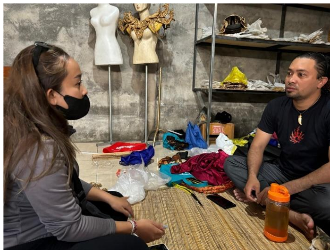
Gambar 1. Pencipta tari (sebelah kiri) melakukan diskusi terkait konsep karya tari bersama pemilik Sanggar Pancer Langiit (sebelah kanan).