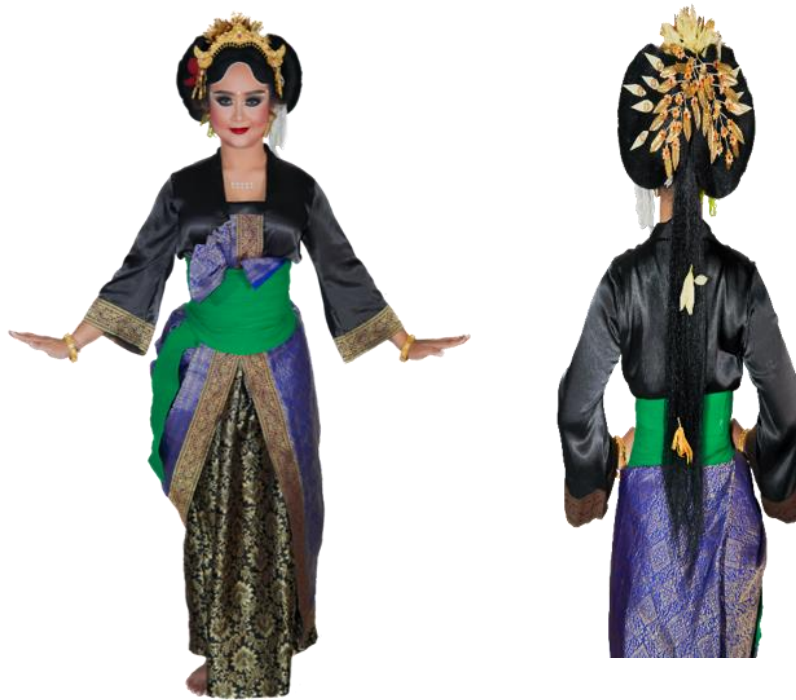
Gambar 4. Tampak Belakang dan Depan tata busana Tari Pilahing Watu