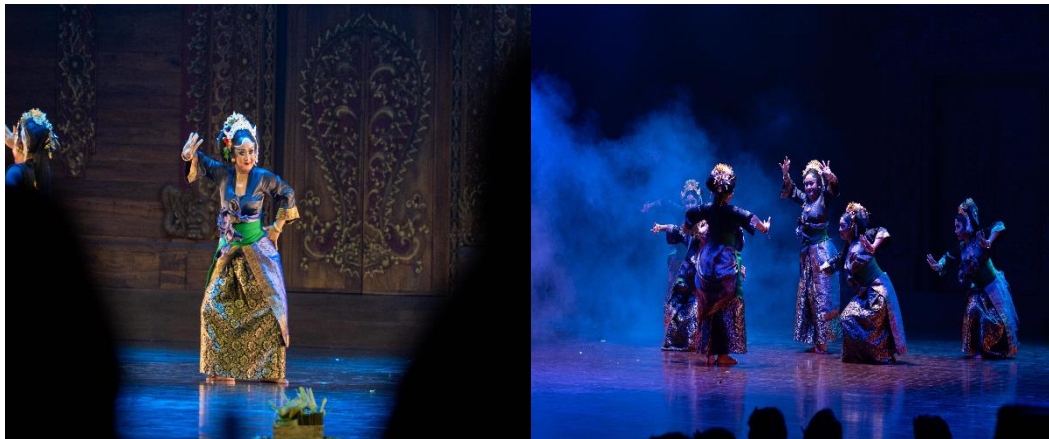
Gambar 5. Pementasan Tari Pilahing Watu di Gedung Natya Mandala ISI Denpasar

Proscenium berarti yang mendahului adegan. Dalam hubungannya dengan perpetaan panggung proscenium, maka dinding yang memisahkan auditorium dengan panggung itulah yang disebut proscenium (Padmodarmaya, 1988: 65). Panggung proscenium digunakan karena panggung proscenium memiliki aspek pendukung dalam pementasan karya seni bersifat akademis. Aspek aspek pendukung tersebut seperti, kebutuhan lampu, wings , backdrop dan fasilitas pendukung lainnya.