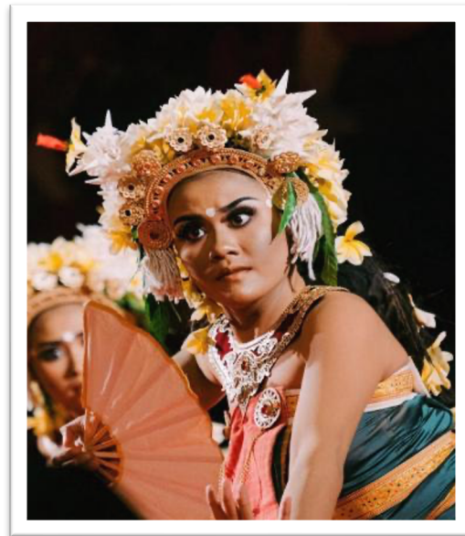
Gambar 3. Ekspresi Penyajian Tari Kembang Ura

Desain kostum dan tata rias Tari Kembang Ura mengadopsi nuansa klasik yang sederhana. Penggunaan kostum yang tidak terlalu glamor justru mengarahkan perhatian penonton pada suasana kontemplatif dan nilai simbolis karya. Tata rias juga tidak diarahkan pada karakterisasi dramatik, melainkan pada penguatan ekspresi lembut dan devosional. Pilihan artistik ini memperlihatkan bahwa unsur visual dalam karya bukan sekadar penghias panggung, tetapi bagian dari sistem tanda yang membentuk makna keseluruhan pertunjukan. Iringan musik Tari Kembang Ura berfungsi terutama sebagai pembangun suasana. Tempo relatif stabil dan dinamika yang terkendali memungkinkan penonton berfokus pada kualitas gerak dan kandungan simbolis karya. Suasana dramatik tidak dibangun melalui konflik, tetapi melalui akumulasi rasa yang perlahan, sehingga pengalaman estetis yang dihasilkan cenderung meditatif. Melalui kerangka wiraga, wirama, dan wirasa, kekuatan utama karya ini terletak pada keseimbangan antara teknik tubuh, harmoni ritmis, dan kedalaman penghayatan. Pada Gambar 3 di atas merupakan salah satu ekspresi dalam penyajian Tari Kembang Ura.