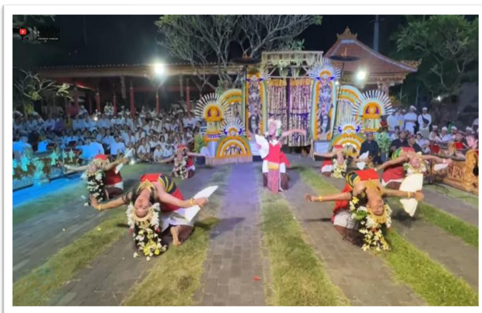
Gambar 1. Bentuk Penyajian Tari Kembang Ura dalam konteks upacara

Tari Kembang Ura disajikan sebagai karya tari kreasi yang berakar pada tradisi hamburan bunga dalam pertunjukan Topeng Sidakarya, namun ditransformasikan ke dalam struktur koreografi yang reflektif dan estetis. Bentuk penyajiannya tidak dimaksudkan sebagai reproduksi literal dari tindakan ritual, melainkan sebagai artikulasi simbolis yang diterjemahkan ke dalam tubuh penari. Dengan demikian, bentuk pertunjukan ini memperlihatkan negosiasi antara ritual dan estetika, di mana makna tidak dihapus, melainkan dimediasi melalui struktur artistik. Berikut ini salah satu penyajian Tari Kembang Ura yang juga disajikan dalam konteks upacara.