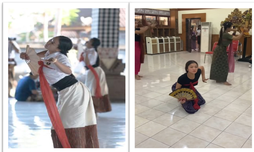
Gambar 6 dan 7. Proses Eksplorasi Gerak Tari Kembang Ura

Proses penciptaan Tari Kembang Ura tidak berlangsung sebagai pemindahan langsung unsur ritual ke panggung, melainkan sebagai proses artistik yang selektif, reflektif, dan berbasis pemahaman terhadap tradisi Topeng Sidakarya. Pengkarya tidak mereproduksi tindakan hamburan bunga secara literal, tetapi mengolahnya menjadi motif gerak utama, suasana estetik, dan struktur pertunjukan yang tetap menjaga inti simboliknya. Dalam proses ini, tradisi hamburan bunga dipahami sebagai sumber inspirasi sekaligus sumber nilai. Karena itu, penciptaan karya tidak berhenti pada eksplorasi bentuk, tetapi juga mempertimbangkan batas etis agar simbol ritual tidak kehilangan kedalaman maknanya. Tari Kembang Ura dengan demikian merupakan hasil transformasi budaya yang sadar, di mana pengkarya menempatkan simbol hamburan bunga sebagai fondasi, bukan sekadar ornamen koreografis. Pengkarya berperan sebagai mediator budaya yang menjembatani tradisi ritual dengan ekspresi tari kreatif kontemporer. Keputusan artistik, seperti pilihan kualitas gerak yang lembut, tempo yang tenang, kostum bergaya klasik, dan penghindaran efek dramatik berlebihan, menunjukkan adanya upaya sadar untuk menjaga suasana kontemplatif dan nilai sakral karya. Dengan demikian, proses penciptaannya bukan hanya proses koreografis, tetapi juga proses negosiasi budaya dan spiritual. Berikut ini merupakan proses eksplorasi dan latihan Tari Kembang Ura.