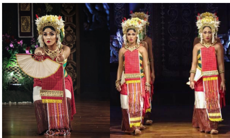
Gambar 4 dan 5. Penyajian Tari Kembang Ura di atas panggung hiburan (Sumber: Galih Mas Narapadi, 2025)

Desain kostum dan tata rias Tari Kembang Ura mengadopsi nuansa klasik yang sederhana. Penggunaan kostum yang tidak terlalu glamor justru mengarahkan perhatian penonton pada suasana kontemplatif dan nilai simbolis karya. Tata rias juga tidak diarahkan pada karakterisasi dramatik, melainkan pada penguatan ekspresi lembut dan devosional. Pilihan artistik ini memperlihatkan bahwa unsur visual dalam karya bukan sekadar penghias panggung, tetapi bagian dari sistem tanda yang membentuk makna keseluruhan pertunjukan. Iringan musik Tari Kembang Ura berfungsi terutama sebagai pembangun suasana. Tempo relatif stabil dan dinamika yang terkendali memungkinkan penonton berfokus pada kualitas gerak dan kandungan simbolis karya. Suasana dramatik tidak dibangun melalui konflik, tetapi melalui akumulasi rasa yang perlahan, sehingga pengalaman estetis yang dihasilkan cenderung meditatif. Melalui kerangka wiraga, wirama, dan wirasa, kekuatan utama karya ini terletak pada keseimbangan antara teknik tubuh, harmoni ritmis, dan kedalaman penghayatan. Pada Gambar 3 di atas merupakan salah satu ekspresi dalam penyajian Tari Kembang Ura.