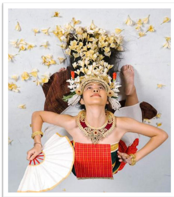
Gambar 8. Adegan simbol hamburan bunga

Makna simbolis berikutnya adalah berkah dan keselamatan. Dalam tradisi Sidakarya, hamburan bunga berfungsi sebagai media penyalur berkah yang menjamin keberhasilan penyelesaian yadnya. Simbol ini beroperasi sebagai penanda hubungan harmonis antara manusia dengan kekuatan ilahi. Dalam Tari Kembang Ura, makna keberkahan dan keselamatan diartikulasikan melalui struktur pertunjukan yang tertutup dan reflektif. Karya tidak ditutup dengan klimaks dramatik, melainkan dengan resolusi yang menegaskan ketenangan, keseimbangan, dan keteraturan batin. Berikut ini merupakan salah satu adegan inti Tari Kembang Ura yang menampilkan simbol hamburan bunga.