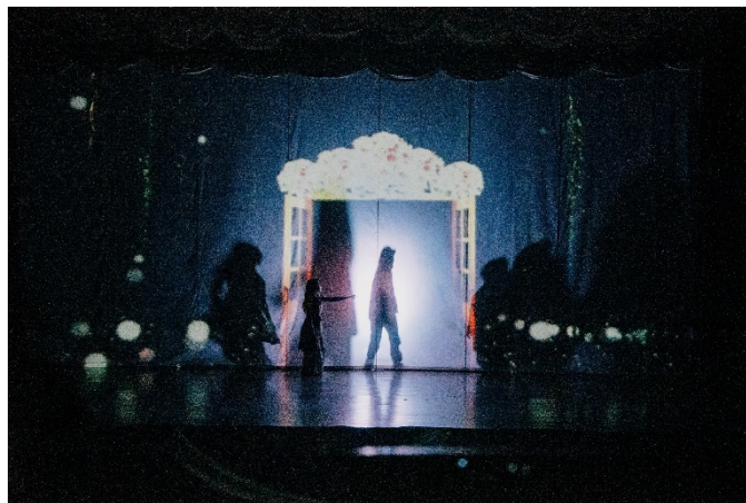
Gambar 1. Pertunjukan Tari Samsaya Citta Bagian Flashback