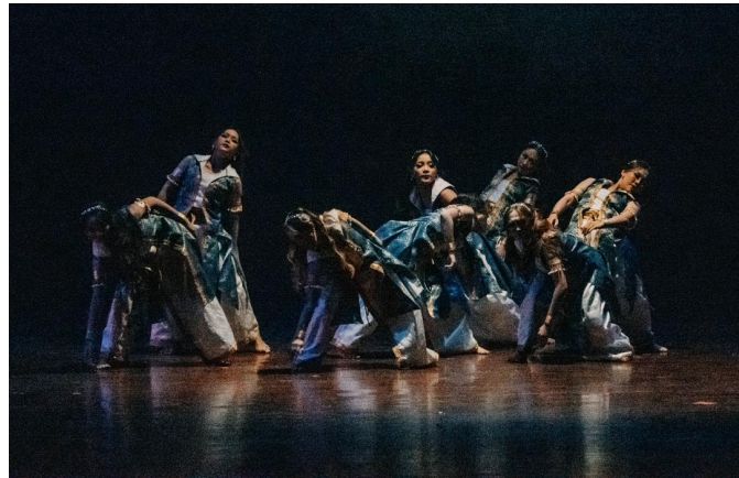
Gambar 2. Pertunjukan Tari Samsaya Citta Bagian I