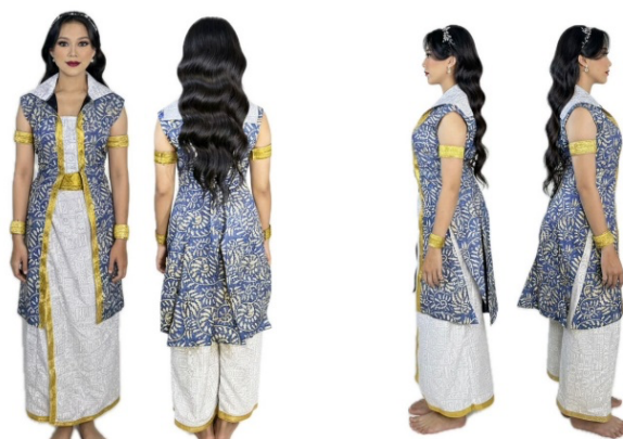
Gambar 4. Tata Rias dan Busana Karya Tari Samsaya Citta (Tampak Depan-belakang dan Tampak Samping Kanan-Kiri)

Pada karya tari Samsaya Citta, tata rias yang digunakan adalah jenis tata rias minimalis dengan sentuhan bold . Tata rias minimalis bold merupakan jenis rias wajah yang menggabungkan tampilan sederhana, tidak berlebihan, dengan penegasan yang kuat pada bagian tertentu wajah. Dalam karya tari Samsaya Citta, bagian wajah yang ditegaskan terlihat melalui penggunaan shading pada area pipi dan lekuk wajah penari. Tata Busana yang digunakan berupa atasan yang menyerupai kebaya tanpa lengan dengan desain memanjang, serta dipadukan dengan celana panjang gombyong dan penggunaan pending . Pemilihan bentuk busana ini bertujuan untuk memberikan keleluasaan gerak bagi penari, sehingga penari dapat mengekspresikan gerak secara maksimal. Selain itu juga dilengkapi dengan penggunaan gelang tangan dan gelang lengan sebagai aksesoris pendukung yang berfungsi untuk memperkuat tampilan visual penari dan menambah nilai estetika. Warna yang digunakan dalam kostum karya tari ini didominasi oleh warna biru, putih, dan emas karena ketiga warna tersebut memiliki makna simbolik yang selaras dengan konsep karya.