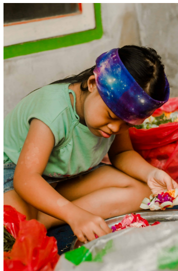
Gambar 5. “Metanding”