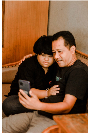
Gambar 4. “ True Love “