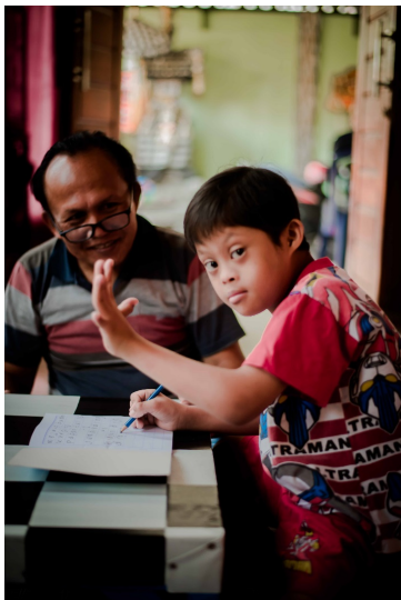
Gambar 3. “ Mendampingi “ Bahan : Adhesive Ukuran : 50X40cm

Pada karya di atas berjudul “ Mendampingi ” kenapa menggunakan judul tersebut karena terlihat pada karya di atas seorang ayah yang mendampingi anaknya yang sedang mengerjakan tugas yang diberikan oleh gurunya dan terlihat ekspresi dari ayah yang senang melihat anaknya yang semangat mengerjakan tugas walaupun sang anak memiliki kebutuhan khusus tetapi semangat untuk belajarnya sangat tinggi yang sama seperti anak-anak normal lainnya.