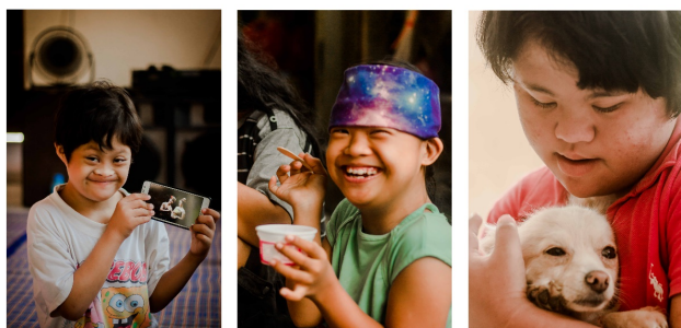
Gambar 2. “ Hadiah Dari Tuhan “