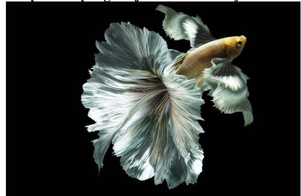
Gambar 1. “Pucuk Arjuna”, 2021 Cetak foto bahan adhesive, 40 cm x 60 cm.

Dalam visualisasi karya “Pucuk Arjuna”, Secara ideational penulis mendapatkan inspirasi atau ide dari makna keanggunan yang dimiliki bunga pucuk arjuna, bunga pucuk arjuna kerap digunakan hiasan untuk undeng sebagai kesan keagungan dari pria. Penulis menampilkan garis dalam karya ini, dengan menampilkan garis lengkung pada ekor ikan cupang hias yang menimbulkan kesan dinamis pada karya ini. Warna yang menonjol pada karya ini penulis menampilkan warna putih yang menampilkan kesan keanggunan pada karya ini. Kesan keindahan pada karya ini penulis menggunakan tekstur semu, pusat perhatian pada karya ini adalah ikan cupang hias.