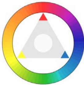
Gambar 2. 1 Warna Primer

Warna-warna yang dihasilkan dari pencampuran warna-warna primer (biru, merah, dan kuning) dalam satu ruang warna. Hasil pencampuran warna primer terdiri dari Hijau (Biru + Kuning), Oranye (Kuning + Merah), Ungu (Merah + Biru).