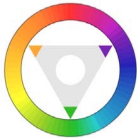
Gambar 2. 2 Warna Sekunder

Warna-warna yang dihasilkan dari pencampuran warna-warna primer (biru, merah, dan kuning) dalam satu ruang warna. Hasil pencampuran warna primer terdiri dari Hijau (Biru + Kuning), Oranye (Kuning + Merah), Ungu (Merah + Biru).