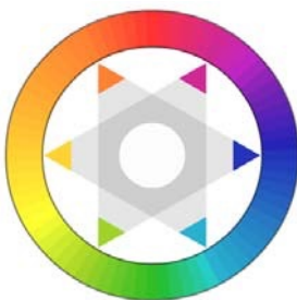
Gambar 2. 3 Warna Tersier

Warna yang dihasilkan dari campuran satu warna primer dengan satu warna sekunder dalam sebuah ruang warna.