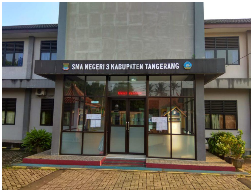
Gambar 1. Tampak SMAN 3 Kabupaten Tangerang

Objek penelitian yaitu SMAN 3 Kabupaten Tangerang yang berlokasi di I. Raya Curug No.KM.2, Kadu Jaya, Kec. Curug, Tangerang, Banten 15810. Sekolah ini menerapkan sistem pembelajaran Kurikulum 2013 dan terdiri dari dua penjurusan yaitu IPA dan IPS. Secara keseluruhan, bangunan sekolah ini menggunakan organisasi terpusat yang alur sirkulasinya berpusat pada lapangan sekolah. Sementara penataan ruang kelas disusun secara linier. Layout ruang kelas di sekolah ini menerapkan formasi tradisional dimana bangku disusun berbaris dari depan ke belakang dan setiap meja diisi oleh dua siswa. Ruang kelas dilengkapi fasilitas berupa meja dan kursi siswa, meja dan kursi guru, papan tulis, layar dan proyektor, speaker , kipas angin, dan beberapa ruang dilengkapi dengan AC.