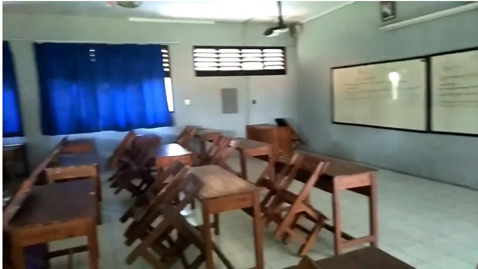
Gambar 2. Ruang Kelas SMAN 3 KABUPATEN TANGERANG

Dari hasil pengumpulan data yang diperoleh melalui penyebaran kuesioner online berupa Google Form, telah terkumpul 143 responden. Seluruh responden adalah siswa SMA Negeri 3 Kabupaten Tangerang. Berikut data hasil penelitian dan responden dari 143 data yang telah dikumpulkan.