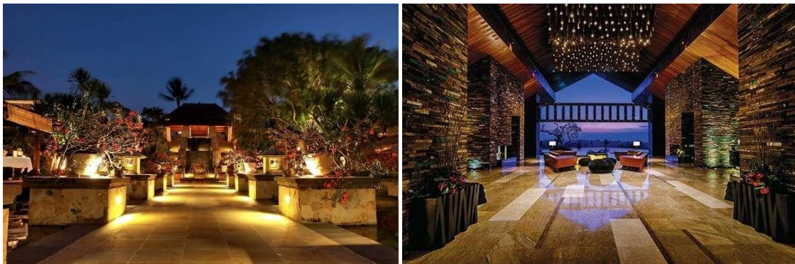
Gambar 3. Lansekap dan Interior Lobby

Pada lansekap, jalur sirkulasi didesain dengan konfigurasi kontur tanah dalam wujud planter box serta penempatan vegetasi jenis pohon kamboja ( plumeria ). Selain mampu menghadirkan kesan estetis, pembuatan elevasi dengan memanfaatkan kontur tanah dapat membelokkan pergerakan angin ke masing-masing massa bangunan. Selain itu, elevasi pada lantai lansekap serta adanya jenis vegetasi pohon juga mampu menurunkan kecepatan angin yang masuk kedalam interior. Hal serupa juga dihadirkan pada interior lobby. Bukaan ruang yang lebar menghadap ke arah laut disiasati dengan pembuatan elevasi elemen plafond yang tinggi. Pergerakan angin dari laut yang membentur lansekap dengan vegetasi jenis pohon akan berbelok sampai pada bagian atas plafond sehingga area aktivitas mendapatkan intensitas angin yang sedang (Latifah, 2015). Hal tersebut juga menyebabkan keterpaduan strategi penghawaan silang yang dapat memaksimalkan sirkulasi juga meminimalkan suhu udara dala ruang untuk mencapai kenyamanan termal di dalam bangunan (Nugroho, 2019).