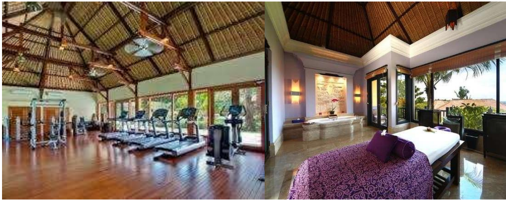
Gambar 6. Interior ruang Spa dan Gym

Konsep ekologi pada interior hotel Ayana Resort and Spa khususnya pada ruang gym dan spa diaplikasikan dengan membuat elevasi pada bagian elemen plafond. Desain plafond dihadirkan dengan memperlihatkan struktur rangka dan material sehingga jarak antara lantai dan plafond menjadi tinggi. Jarak antara area aktivitas dengan plafond yang tinggi dapat dijadikan salah satu cara untuk menyiasati pengaturan konisi termal dalam ruang. Udara panas hasil penyerapan material atap akan mengalami penurunan intensitas selama berada di plafond sehingga kondisi pada area aktivitas dapat kembali normal,