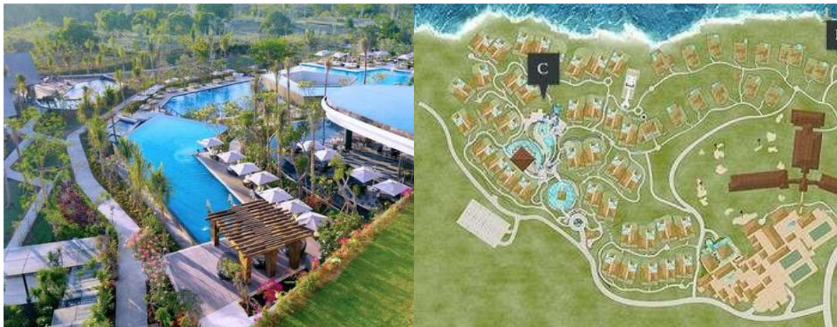
Gambar 1. Penataan Bangunan Dan Lansekap

Salah satu ruang komersial yang dapat dijadikan contoh dalam aplikasi penerapan konsep ekologi adalah hotel Ayana Resort and Spa. Pemilihan hotel Ayana Resort and Spa sebagai objek adalah bertahannya Ayana sebagai parameter hotel serta menjadi legenda khususnya di Bali. Dari sisi ekologi, hotel Ayana Resort and Spa menghadirkan konsep yang menyatukan antara vegetasi sebagai perwakilan dari alam dengan arsitektur dan interior. Pemakaian material yang digunakan pada arsitektur dan interior juga masih tergolong hemat energi. Pamakaian atap alang-alang, batu kapur serta beberapa vegetasi yang memiliki kesesuaian habitat dengan site. Pemilihan material dan elemen vegetasi tersebut tentunya mempertimbangkan sisi kemudahan dalam mendapatkan material namun tanpa mengurangi nilai dan estetika (Mediastika, 2013). Berdasarkan tampilan denah dapat dilihat bahwa perbandingan antara Ruang Terbuka Hijau dengan Koefisien Dasar Bangunan (KDB) terlihat masih proporsional sesuai dengan standar yang telah ditetapkan.