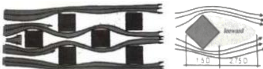
Gambar 2. Konfigurasi Dan Posisi Bangunan

Terkait penghawaan dan pencahayaan alami, Hotel Ayana Resort and Spa menyiiasi konfigurasi bangunan dengan membentuk pola radial atau cenderung ke arah acak. Masing-masing diberikan jarak untuk tetap menjaga pergerakan udara sampai ke bangunan yang berada disisi paling utara. Selain konfigurasi bangunan, pemilihan vegetasi jenis pohon juga difungsikan sebagai pengatur kondisi termal.