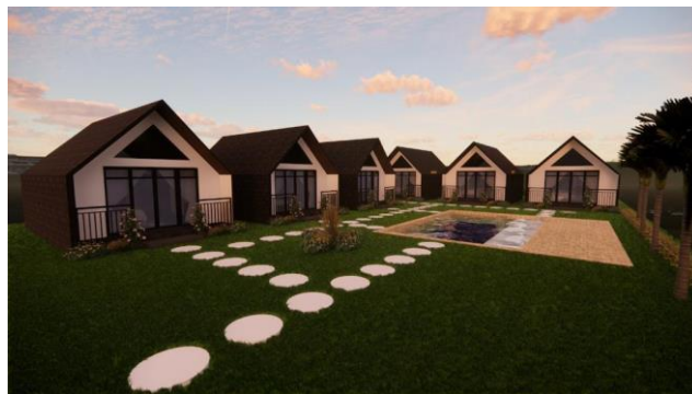
Gambar 7. Fasad villa Padi Canggu

Hasil akhir dari proses desain furniture villa padi canggu setelah beberapa kali melakukan proses revisi desain hingga sesuai dengan keinginan dari klien dan telah terwujud beberapa desain 3D modeling beserta dengan gambar kerja.