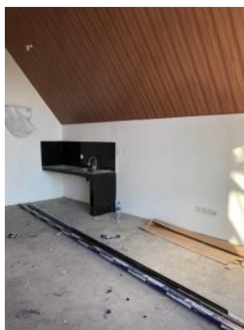
Gambar 2. Dokumentasi kondisi eksisting

Dokumentasi dilakukan untuk dijadikan acuan kondisi dilapangan untuk mempermudah proses pengerjaan desain.