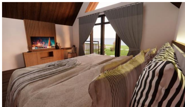
Gambar 8. Desain Meja Tv