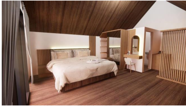
Gambar 9. Desain bed, Lemari, dan Meja Rias