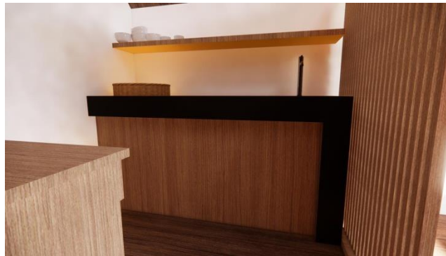
Gambar 4. Desain Kitchen