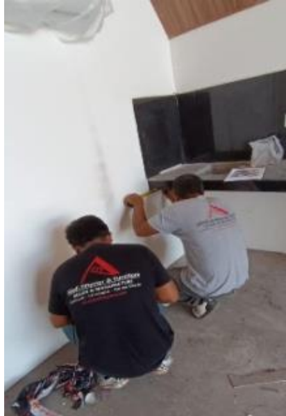
Gambar 1. Pengukuran di lokasi proyek

Pengukuran dilokasi proyek dilakukan bersama mandor tukang Abadi Furniture. pengukuran dimulai dari mengukur luas lantai yang akan di isi furniture dan tinggi tembok agar dapat menyesuaikan saat proses produksi di workshop. pengukuran dilakukan juga sebagai acuan saat proses pembuat gambar kerja.