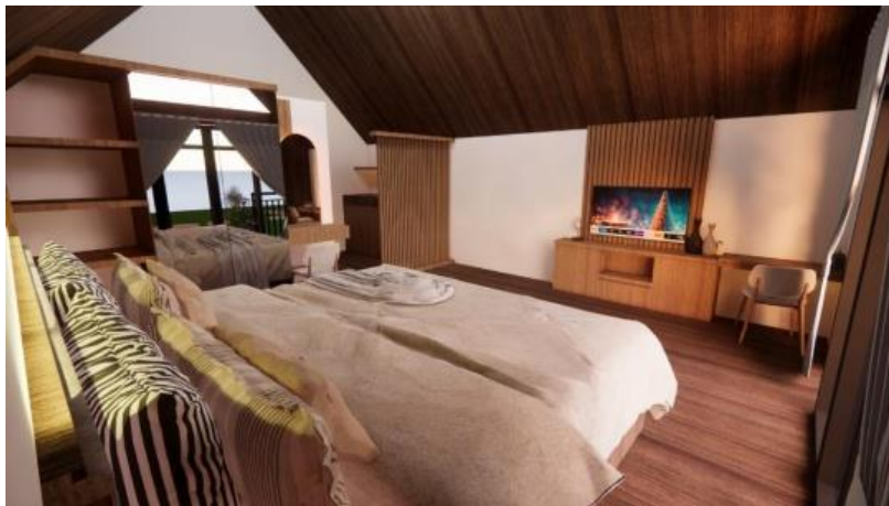
Gambar 4. Hasil Desain dan Rendering kamar villa padi

Pengerjakan gambar 3D modelling dengan informasi projek yang di dapat langsung di lapangan dengan melakukan pengukuran di lokasi projek. Pengerjaan desain ini dilakukan di rumah bapak Adi Tiaga.